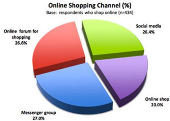
Gambar I.2 Online shopping channel

forum online untuk berbelanja memiliki persentase 26,6%, social media memiliki persentase 26,4%, dan online shop memiliki persentase 20%.