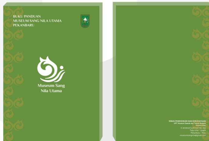
Cover depan dan belakang