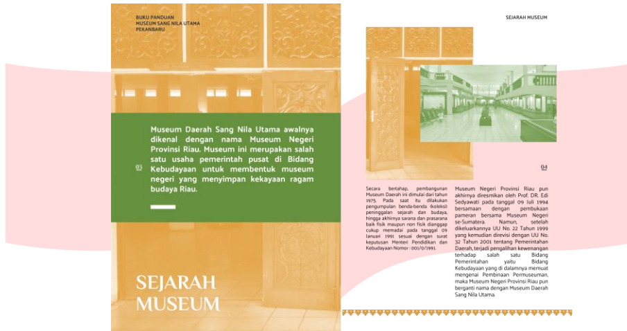
Isi buku