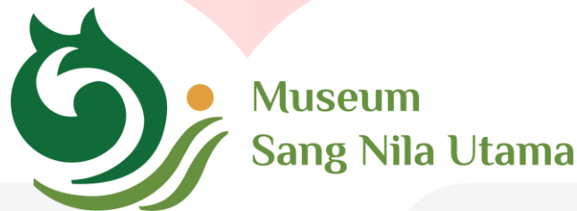
Logo Museum