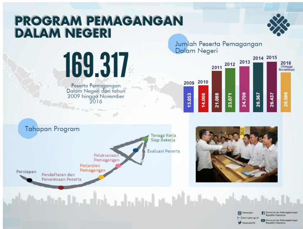
Gambar 1.4 Jumlah peserta pemagangan periode 2009-2016

Sumber : ( https://www.kemdikbud.go.id/main/2016/12/pemagangan-cara-pemerintah-kebut-peningkatan-daya-saing-tenaga-kerja )