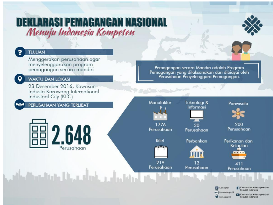
Gambar 1.5 Jumlah perusahaan yang terlibat dalam program pemagangan mandiri