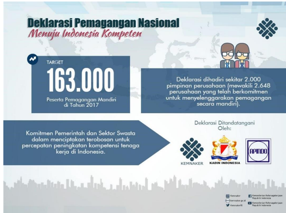
Gambar 1.6 Jumlah peserta yang mengikuti program pemagangan tahun 2017