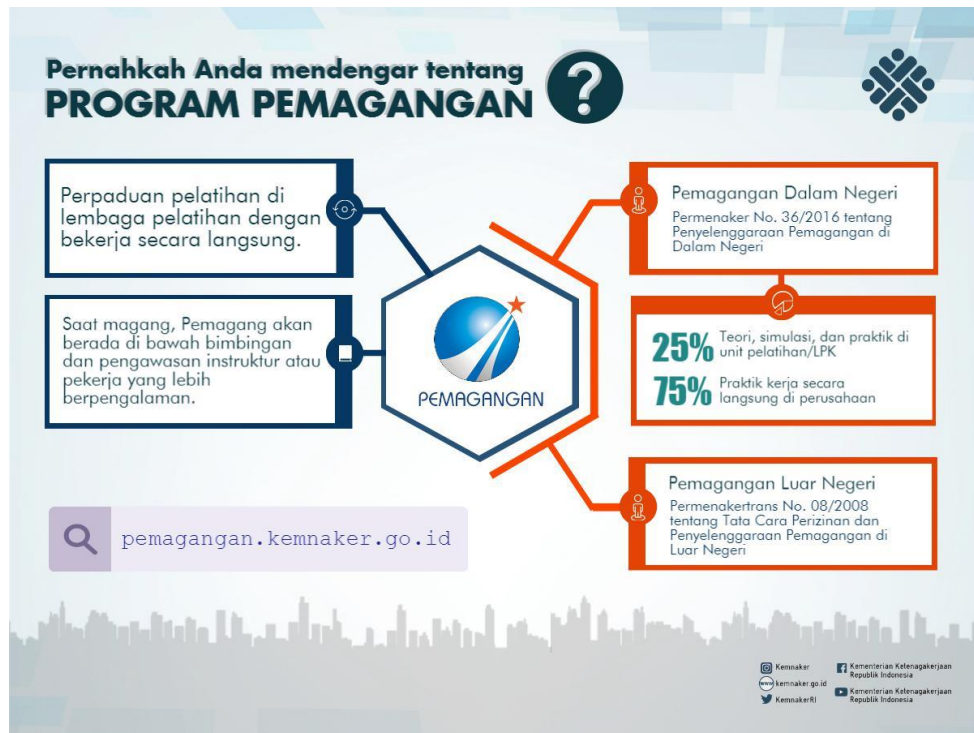
Gambar 1.1 Program Pemagangan

Sumber : ( https://www.kemdikbud.go.id/main/2016/12/pemagangan-cara-pemerintah-kebut-peningkatan-daya-saing-tenaga-kerja )