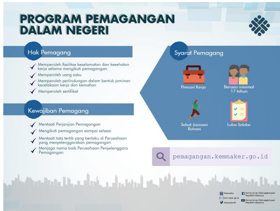
Gambar 1.2 Hak dan Kewajiban peserta program pemagangan

Sumber : ( https://www.kemdikbud.go.id/main/2016/12/pemagangan-cara-pemerintah-kebut-peningkatan-daya-saing-tenaga-kerja )