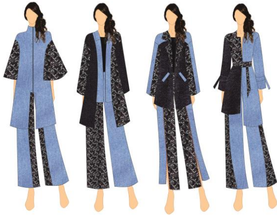
Gambar 2 Sketsa Produk

Setelah melakukan proses eksplorasi, tahap selanjutnya adalah mengaplikasikannya ke dalam proses desain. Koleksi perancangan ini terdiri dari 4 look . Dimana dari keempat look menggunakan dua komposisi motif berdasarkan eksplorasi terpilih. Setiap look terdiri dari basic item dengan diberikan beberapa sentuhan formal menggunakan dua variasi warna denim. Juga pada perancangan ini menggunakan oversized item . Keseluruhan look ini menggunakan material denim yang sudah melalui tahap pencucian dan denim yang sudah melalui tahap bleaching . Berikut merupakan detail sketsa produk;