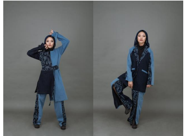
Gambar 4 Produk Akhir (2)