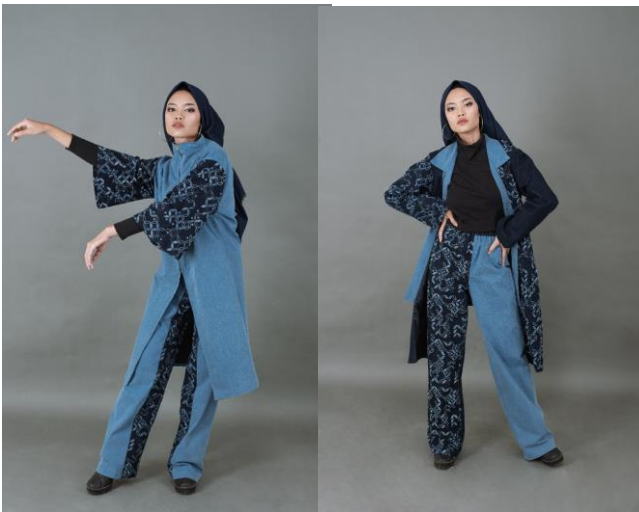
Gambar 3 Produk Akhir

Setelah itu memasuki beberapa tahap produksi hingga akhirnya terealisasi. Berikut hasil produk akhir dari penelitian ini;