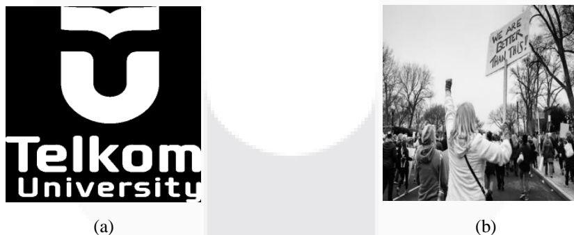
(a) (b) Gambar 3. (a) Secret Image dan (b) Host Image

Pada tugas akhir ini, menggunakan grayscale citra dan watermark berupa citra yaitu secret image . Host image memiliki ukuran 512x512 pixel. Citra watermark yang digunakan untuk pada proses enkripsi merupakan citra yang sama dengan 2 buah ukuran yaitu 32x32 pixel dan 64x64 pixel. Berikut adalah citra yang digunakan.