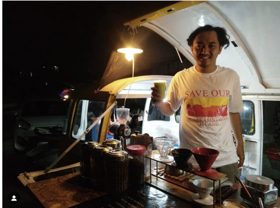
Gambar 1.4 Salah Satu Barista Widjie Coffee