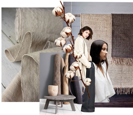
Gambar : Image Board