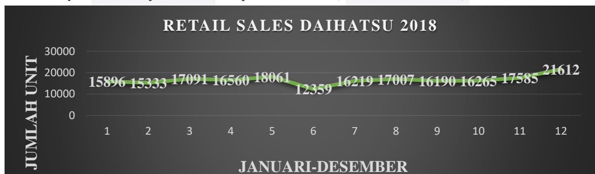
GAMBAR 1. Retail Sales Daihatsu 2018

Pencapaian Daihatsu pada tahun 2016 bisa dikatakan wonderful. Target yang di tetapkan pada awal tahun hanya mempertahankan pangsa pasar sama dengan tahun sebelumnya, yaitu 15%. Daihatsu Sigra pun baru keluar di semester kedua. Artinya, konsistensi PT. Astra International Daihatsu dalam memasarkan mobil-mobilnya telah menunjukkan keandalan produk Daihatsu (sumber Gaikindo.or.id)