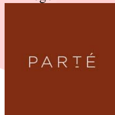
Gambar 1 Logo PARTE

Mengingat bahwa perkembangan teknologi saat ini sangat cepat, banyak pelaku usaha memanfaatkan perkembangan tersebut menjadi kesempatan dalam menjalankan usahanya, maka strategi komunikasi dalam pemasaran sangat dibutuhkan oleh setiap perusahaan maupun pelaku usaha kecil lainnya untuk mencapai tujuan yang diinginkan dan dapat hasil yang maksimal. Komunikasi pemasaran adalah sebuah kegiatan pemasaran yang menggunakan proses komunikasi untuk memberikan informasi kepada khalayak agar mencapai tujuan perusahaan dan dapat terjadi peningkatan hasil pendapatan atas produk yang telah dipasarkan. (dalam Kusniadjii,2016:86).