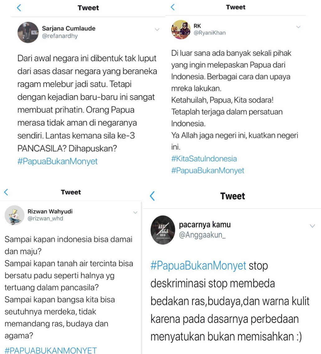
Gambar 1.3 Tweet mengenai tagar #PapuaBukanMonyet

Sumber : Twitter diakses pada tanggal 16 September 2019 pukul 19.44 WIB