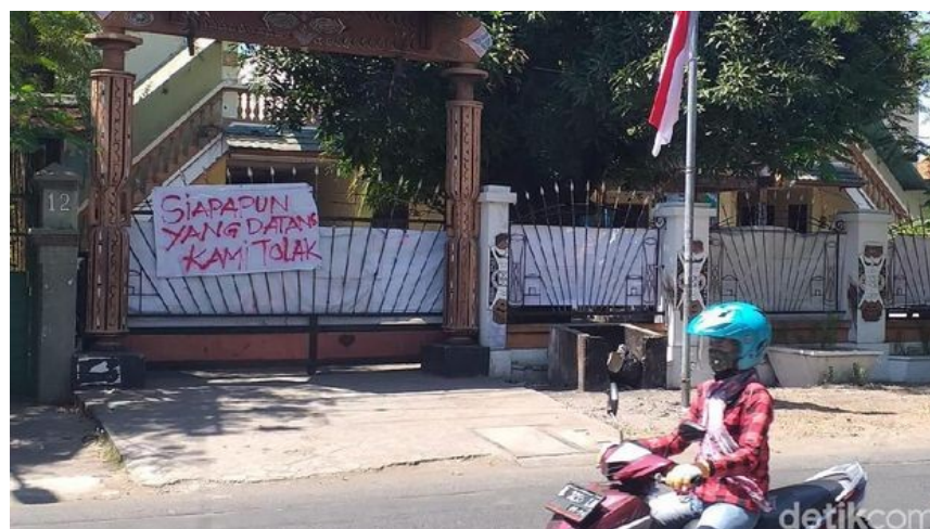
Gambar 1.1 Kondisi asrama mahasiswa Papua di Surabaya setelah pengepungan