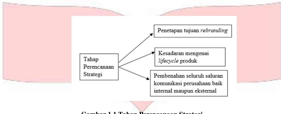
Gambar 1.1 Tahap Perencanaan Strategi

disampaikan oleh manajemen dapat tersampaikan dengan baik kepada karyawannya serta melakukan penyeragaman terhadap seluruh akun sosial media dari perusahaan dengan tujuan memudahkan karyawan dan masyarakat dalam menerima informasi mengenai perusahaan.