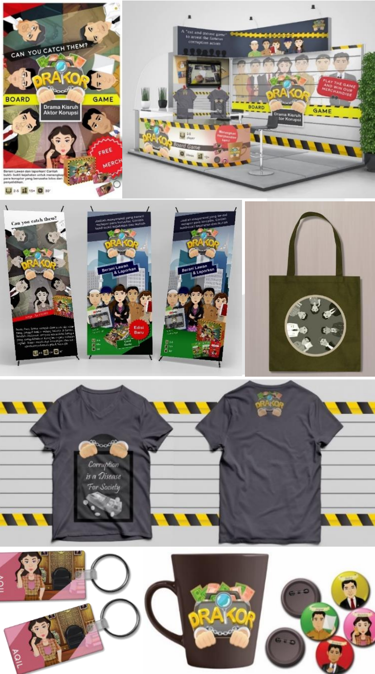
Gambar 4. 2 Media Pendukung : Pameran dan Merchandise