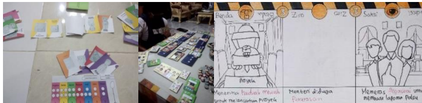
Gambar 4. 1Prototype dan Play test Board Game

Selama merancang, penulis membuat cerita dari kumpulan kasus-kasus dari tokoh koruptor terkenal, menjadi konsep, referensi dan material dalam board game . Dalam merancang board game , penulis membuat sketsa pada setiap komponen kartu, papan dan token, lalu membuat prototype . Prototype sangat penting untuk mengetahui ke-efektivan permainan, penentuan jumlah komponen, ukuran, tulisan yang digunakan, serta isi desainnya. Setelah itu, penulis mengadakan play test board game Drakor untuk dimainkan dan diuji oleh orang lain. Banyak saran yang terkumpul dari para tester dan sangat berguna bagi penulis.