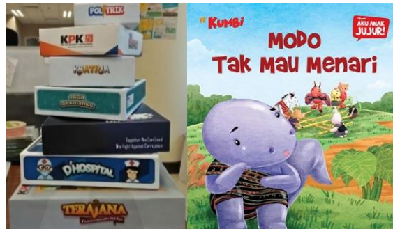
Gambar 2. 1 Media Edukasi KPK