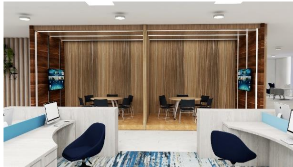
Gambar 3.1 Ruang Kolaborasi 6 pax