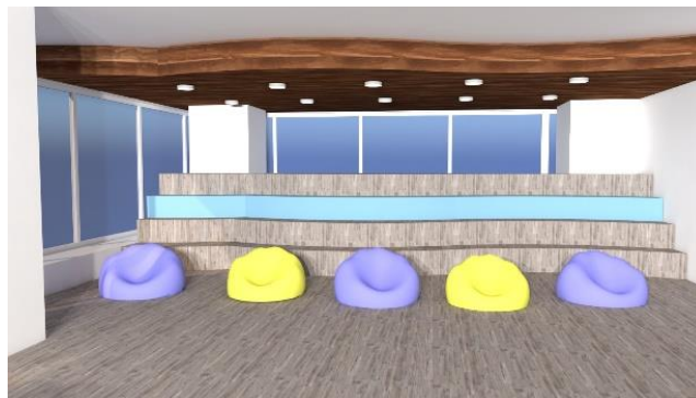
Gambar 3.4 Tribune Ruang Komunal