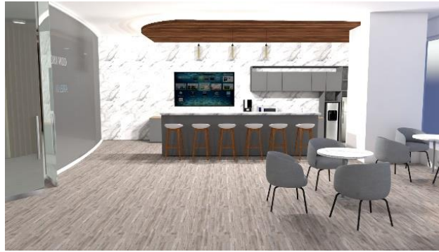
Gambar 3.3 Pantry