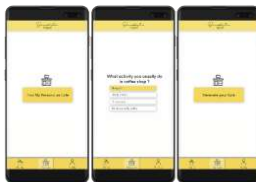
Gambar 3 UI Fitur My Cafe

Konsep kreatif yang diusung adalah untuk merancang media berkumpul bagi pengusaha dan konsumen melalui aplikasi yang bersifat lebih personal, dengan tujuan untuk menjaga prinsip customer service pada coffee shop . Hal ini diwujudkan dalam fitur my cafe yang bekerja dengan cara menyortir coffee shop yang sesuai dengan kebutuhan konsumen melalui pertanyaan yang bersifat personal, dalam upaya mendapatkan informasi kebiasaan konsumen.