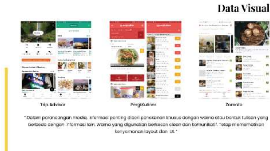
Gambar 1 Rangkuman Analisis Visual

Berdasarkan hasil analisis visual dari aplikasi kuliner Trip Advisor , PergiKuliner , dan Zomato , konsep visual yang umum digunakan adalah clean design yang memiliki tampilan ringkas dan didominasi oleh white space (Levitt, 2019) serta menjaga interaksi dengan pengguna melalui aplikasi yang komunikatif (Terry, 2019).