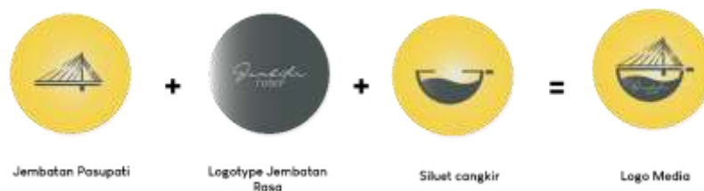
Gambar 2 Penjelasan Logo Jembatan Rasa

Konsep pesan yang diusung sebagai inti perancangan adalah “menjembatani” yaitu menghubungkan pengusaha dengan target audience melalui informasi coffee shop . Dari kata kunci “menjembatani” maka nama aplikasi yang dirancang adalah Jembatan Rasa .