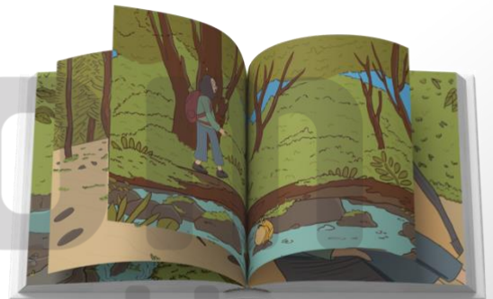
Isi Halaman Buku

Cover pada Buku menggunakan tokoh karakter pada pengkaryaan ini yaitu kelana agar menjadi point of interest untuk orang-orang yang melihat buku tersebut sehingga menjadi daya tarik untuk mau membacanya.