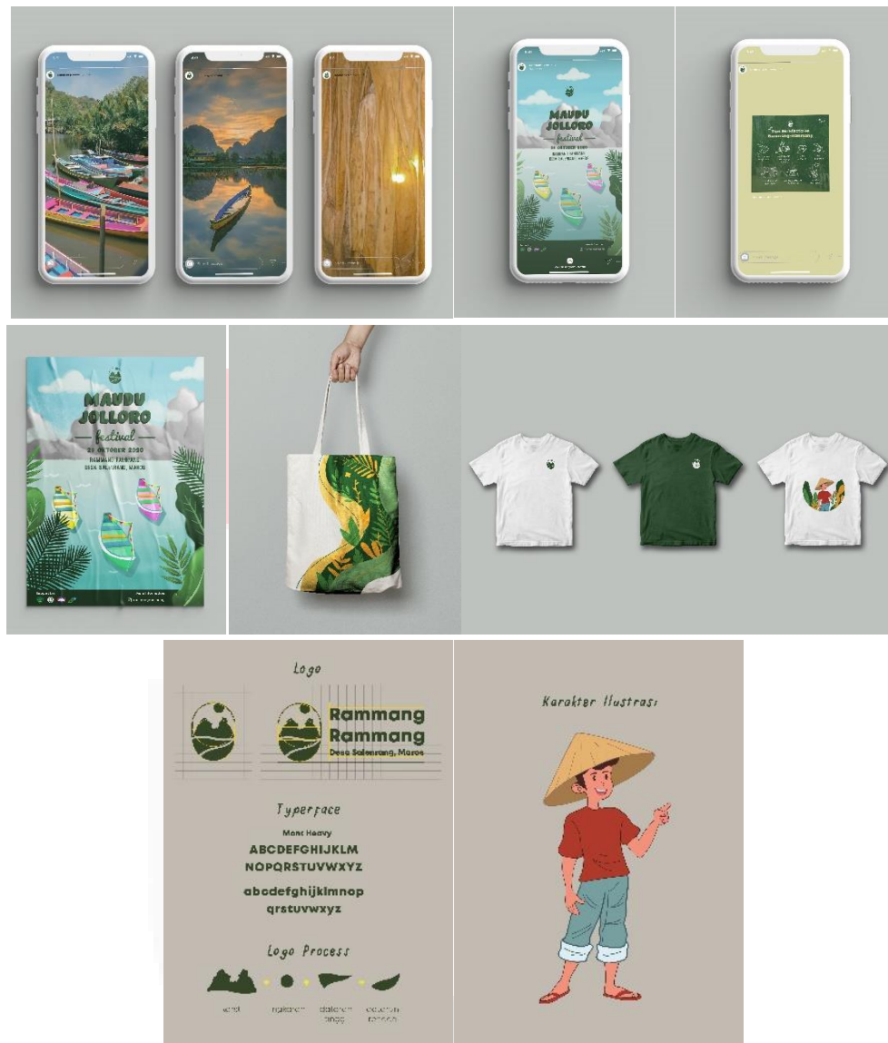
Gambar 4.3 Media Pendukung