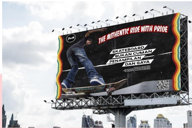
Gambar 3.6 Billboard