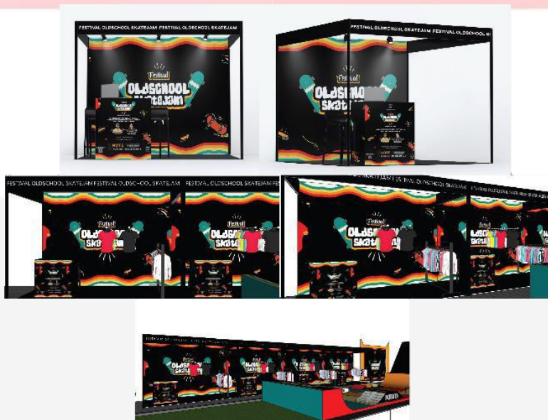
Gambar 3.6 Booth Event