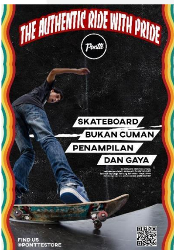
Gambar 3.4 Poster