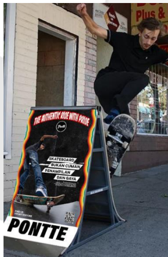
Gambar 3.5 Obstacle ads