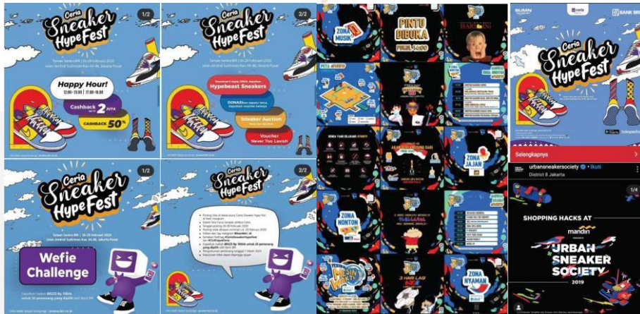
Gambar 3.3 Studi Visua Poster