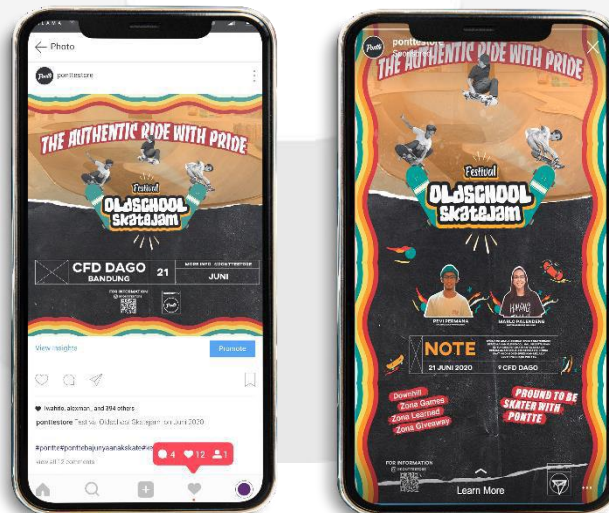
Gambar 3.7 Instagram Ads