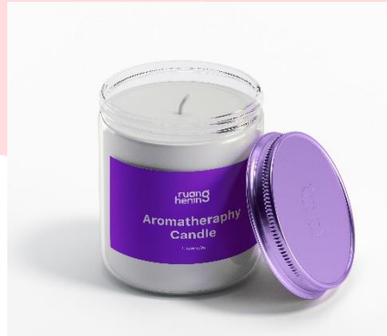
Gambar 4 Merchandise

Selain media pendukung, ada merchandise yang dapat digunakan sebagai media promosi.