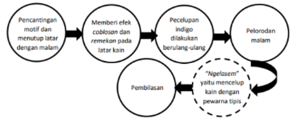
Gambar 4 Tahapan Proses Pembuatan Batik Biron