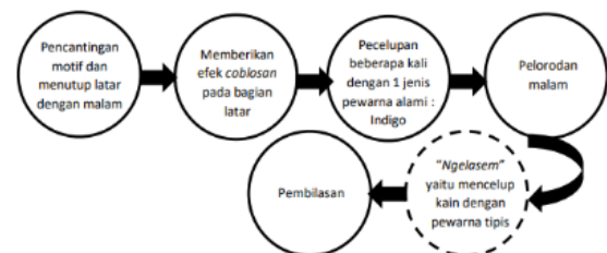
Gambar 1 Tahapan Proses Pembuatan Batik Putihan