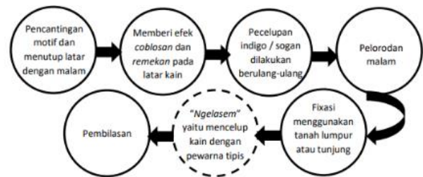
Gambar 5 Tahapan Proses Pembuatan Batik irengan

e. Irengan memiliki warna gelap yang dihasilkan dari pencelupan warna alami yang dilakukan berkali-kali hingga menghasilkan warna gelap yang mendekati warna hitam.