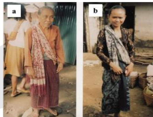
Gambar 6 Penampilan Perempuan Kerek dengan Sayut dan Jarit

tersebut dikarenakan kain jarit dan sayut tidak memiliki filosofi suci sejak awal dan tidak adanya aturan tentang penggunaan kain tersebut dengan benar. Tidak sedikit perempuan Kerek menganggap bahwa penggunaan kain tersebut hanyalah kebiasaan yang diajarkan kepada generasi. Hal tersebut terbukti karena penggunaan kain tersebut sebagian besar digunakan oleh orang tua dan beberapa perempuan Kerek sudah meninggalkan penggunaan kain tersebut (Ciptandi, F., Sachari, A., Haldani, A., & Sunarya, Y. Y., 2018).