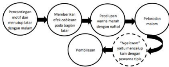
Gambar 2 Tahapan Proses Pembuatan Batik Bangrod