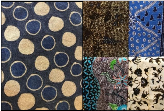
Gambar 7 Motif Batik Kreasi Pengrajin di Tuban

membutuhkan waktu yang lama. Oleh karena itu batik cap menjadi cara yang lebih efektif untuk membuat Batik Gedog Tuban.