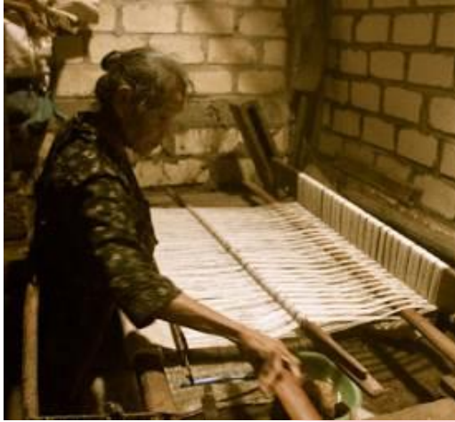
Gambar 8 Pengrajin Kain Tenun Gedog Tuban