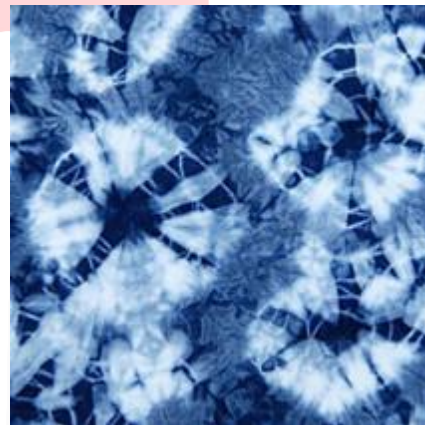
Gambar 10 Kain Ikatan Celup

celup adalah salah satu hasil karya seni yang mengalami banyak sentuhan dan pengaruh dari beragam budaya. Ikatan celup itu sendiri dapat dikategorikan sebagai produk multikultural dan menjadi sebuah hasil budaya manusia yang lahir seiring dengan kemajuan pola pikir manusia itu sendiri (Widodo, 2013:103).