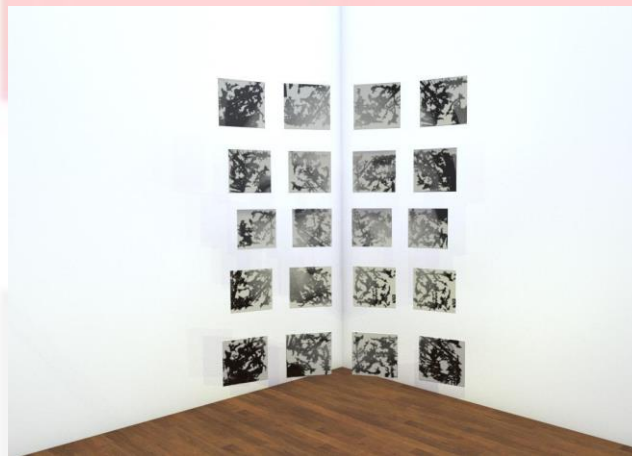
Gambar 1. Sketsa akhir

Penulis sebelumnya melakukan beberapa eksperimen dengan menggabungkan beberapa benda temuan yang acak untuk mendapatkan visual akhir, setelah melakukan proses eksplorasi pada medium cermin dan benda temuan lainnya, penulis merasa pengikisan pada bagian belakang cermin oleh dan melangsungkan reaksi HCl setelahnya ke cermin merupakan suatu proses yang berkesan, juga melakukan teknik transfer image setelahnya merupakan hal yang melengkapi proses tersebut. Dalam proses berkaryanya, cermin pertama-tama dikikis, pengikisan tersebut dilakukan pada cermin bagian belakang dibantu dengan paint remover , reaksi yang dihasilkan paint remover membuat bagian belakang cermin yang terluar mengelupas namun harus juga dikikis dengan tangan menggunakan alat kikis, pada proses pengikisan tersebut penulis merasa menuangkan emosi dan perasaan yang terpendam