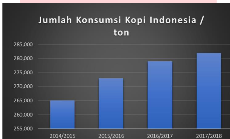
Gambar 1. 1 Jumlah Konsumsi Kopi Indonesia/Ton

Indonesia memiliki keberagaman kekayaan alam dan potensi bisnis yang sangat melimpah, kopi adalah salah satu contoh yang berkembang di Indonesia dengan terjadinya trend positif terhadap konsumsi kopi dalam negeri maupun luar negeri dan salah satu negara dengan penghasil kopi terbesar di dunia. Indonesia mampu memproduksi pada masa panen 2017/2018 mencapai angka 636.000 ton/tahunnya. Jumlah ini didapatkan dari lahan seluas 1 juta hektar. Angka tersebut menjadikan Indonesia berada pada peringkat 4 dalam negara penghasil kopi terbesar di dunia. Hal tersebut sejalan dengan tingkat konsumsi masyarakat terhadap kopi di Indonesia yang selalu bertumbuh setiap tahun nya. Data tersebut dapat dilihat pada tabel dibawah bahwa konsumsi kopi di Indonesia semakin naik dari tahun 2014-2017. Peningkatan tersebut dapat dijadikan sebagai potensi yang besar untuk memulai bisnis pada bidang ini karena permintaan pasar yang selalu naik.