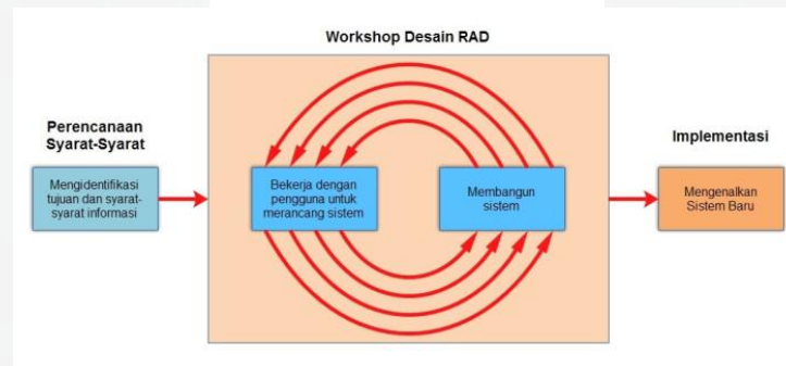
Gambar 1 Tahapan Metode RAD

RAD ( Rapid Application Development ) merupakan metode pengembangan suatu sistem informasi dengan waktu yang sangat singkat. Untuk pengembangan suatu sistem informasi yang normal dibutuhkan waktu selama 180 hari, akan tetapi dengan menggunakan metode RAD ( Rapid Application Development ) suatu sistem yang dapat diselesaikan hanya dalam waktu 30-90 hari [2]. Tahapan Metode RAD dapat dilihat pada Gambar 1.