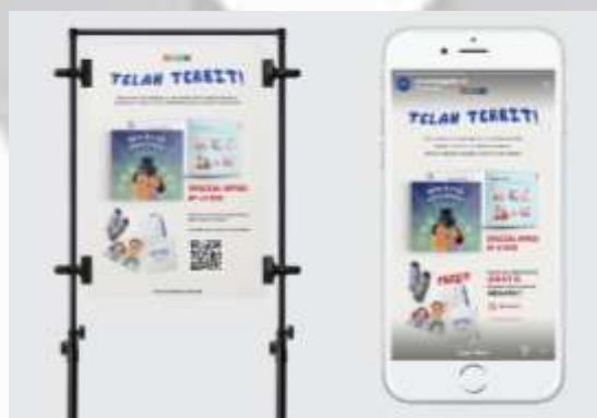
Gambar 4. 23 Poster cetak dan digital