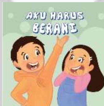
Gambar 4. 13 Ilustrasi judul chapter 3