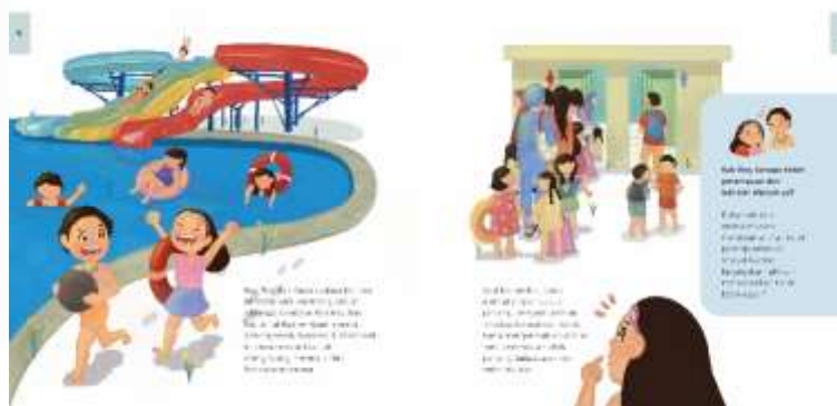
Gambar 4. 16 Ilustrasi Chapter 1 Halaman 4-5 Sumber : Dian Fitri, 2020