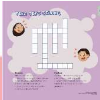
Gambar 4. 7 Kuis Chapter 1 Sumber : Dian Fitri, 2020

Teka-teki silang ini bertujuan untuk menstimulasi daya ingat anak pada isi materi chapter 1.