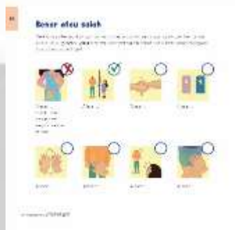
Gambar 4. 8 Kuis Chapter 1

Teka-teki silang ini bertujuan untuk menstimulasi daya ingat anak pada isi materi chapter 1.