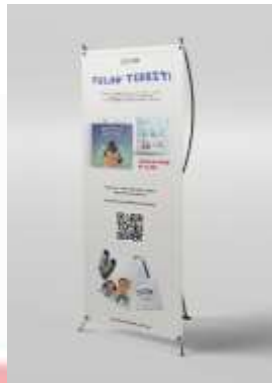
Gambar 4. 24 X-banner