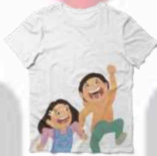
Gambar 4. 25 Merchandise T-Shirt