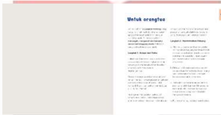
Gambar 4. 22 Materi Untuk Orang Tua Halaman 47