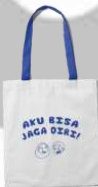
Gambar 4. 26 Merchandise Totebag