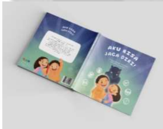
Gambar 4. 6 Sampul Buku "Aku Bisa Jaga Diri!"

Penulis membuat sampul dengan warna cerah, mencolok dan ekspresif agar tidak kalah dengan cover buku pesaing lainnya. Berikut adalah sketsa dan hasil desain sampul depan dan belakang :