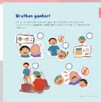
Gambar 4. 11 Kuis Chapter 3

Mengurutkan gambar akan membantu anak berfikir secara logika terhadap kejadian sebab akibat.