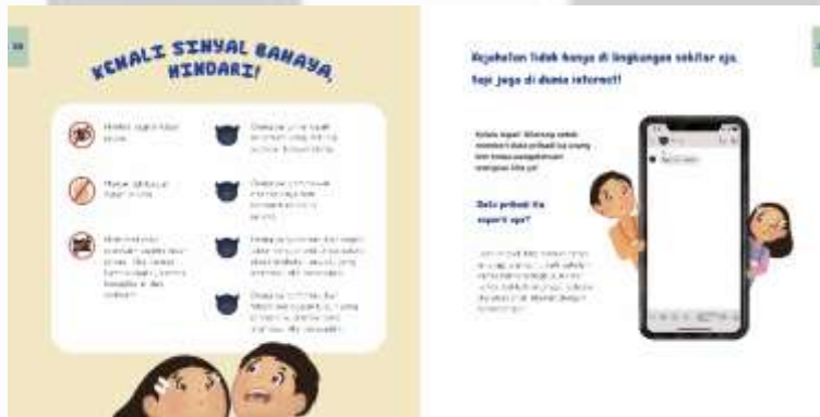
Gambar 4. 19 Ilustrasi Chapter 1 Halaman 20-21 Sumber : Dian Fitri, 2020