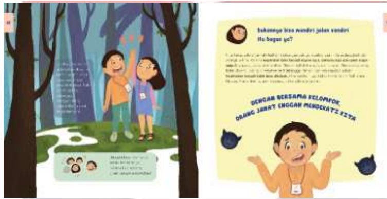
Gambar 4. 17 Ilustrasi Chapter 1 Halaman 18-19