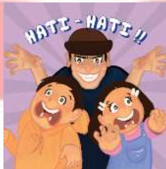
Gambar 4. 14 Ilustrasi judul chapter 2