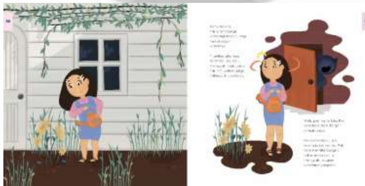
Gambar 4. 20 Ilustrasi Chapter 1 Halaman 30-31