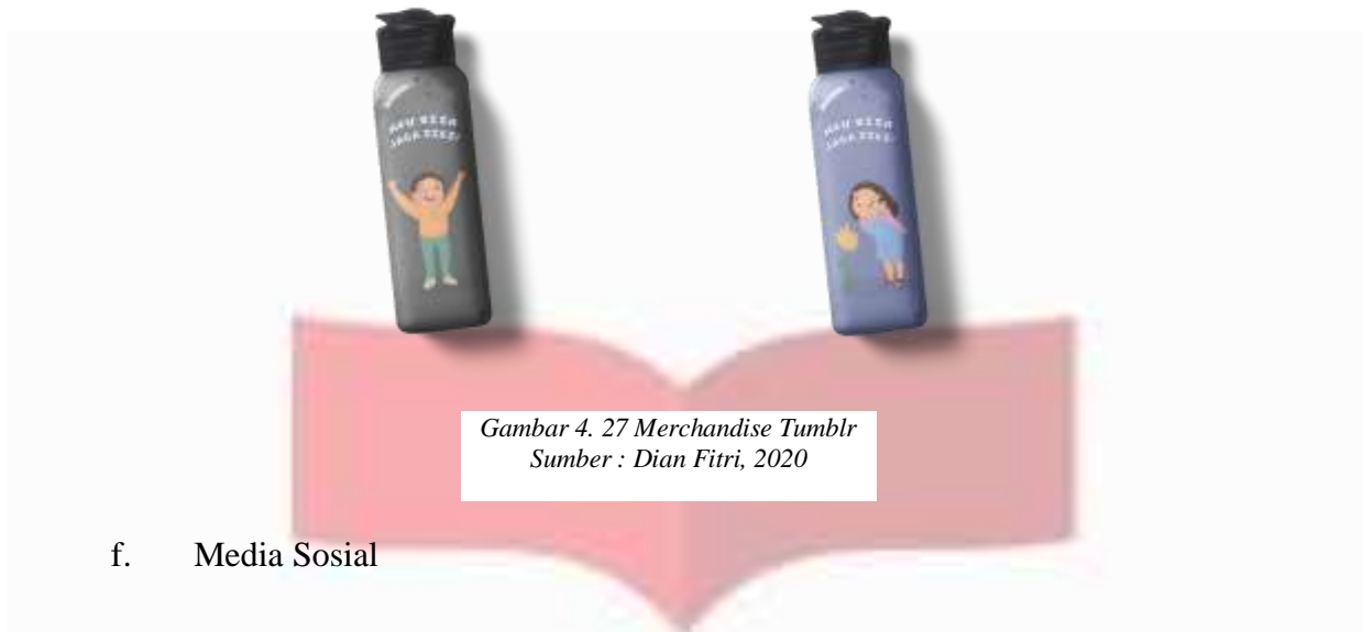
Gambar 4. 27 Merchandise Tumblr