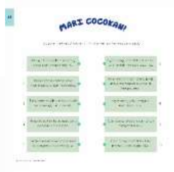
Gambar 4. 10 Kuis Chapter 2

Jenis kuis mencocokkan diharapkan anak dapat menggabungkan dua kejadian yang mengandung hubungan tujuan sehingga anak mengetahui konsekuensi terhadap apa yang mereka lakukan.