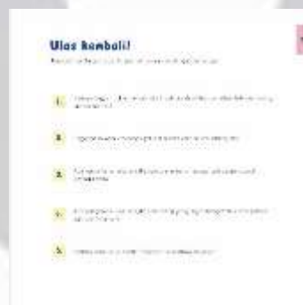
Gambar 4. 12 Kuis Chapter 3

Mengurutkan gambar akan membantu anak berfikir secara logika terhadap kejadian sebab akibat.