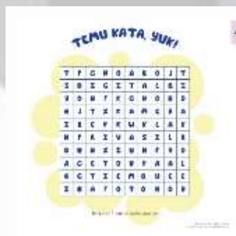
Gambar 4. 9 Kuis Chapter 2

Temu Kata ini bertujuan untuk menstimulasi daya ingat pada kosa kata baru di chapter 2.