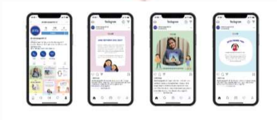
Gambar 4. 28 "Media Sosial Aku Bisa Jaga Diri!"