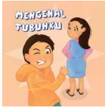
Gambar 4. 15 Ilustrasi judul chapter 1