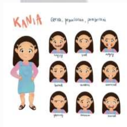
Gambar 4. 1 Ilustrasi Karakter Kania

Penggunaan ilustrasi yang tepat untuk target usia anak adalah gaya ilustrasi kartun. Gaya ilustrasi yang dipilih berdasarkan gaya gambar kartun yang lebih ekspresif dan penuh warna. Penulis membuat 2 karakter yaitu Ray (laki-laki) dan Kania (perempuan). Ray dan karakter perempuan dinamakan Kania. Ray dan Kania adalah kakak adik yang tidak jauh beda umur, yaitu Ray adalah siswa kelas 6 SD dan Kania adalah siswa kelas 4 SD. Ray memiliki sifat kepemimpinan, bijaksanam pintar dan ceria.