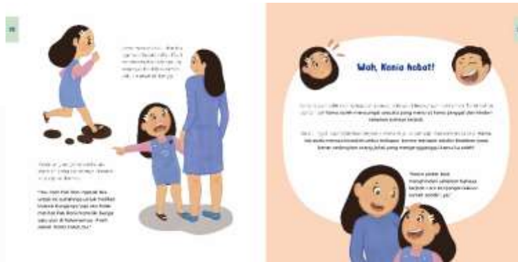
Gambar 4. 21 Ilustrasi Chapter 1 Halaman 30-31