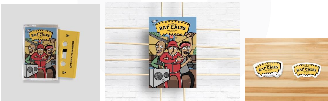
Gambar. 2 Hasil Perancangan Media Pendukung