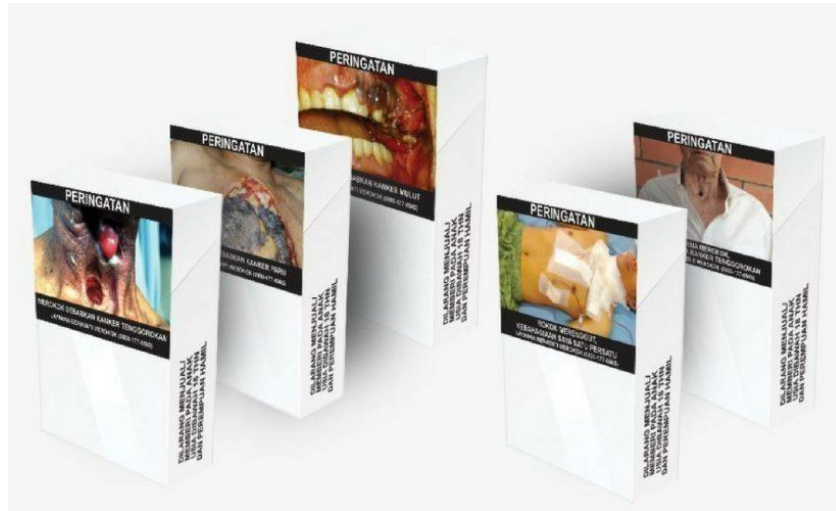
Gambar 1. 2 Komunikasi Visual Pada Kemasan Rokok