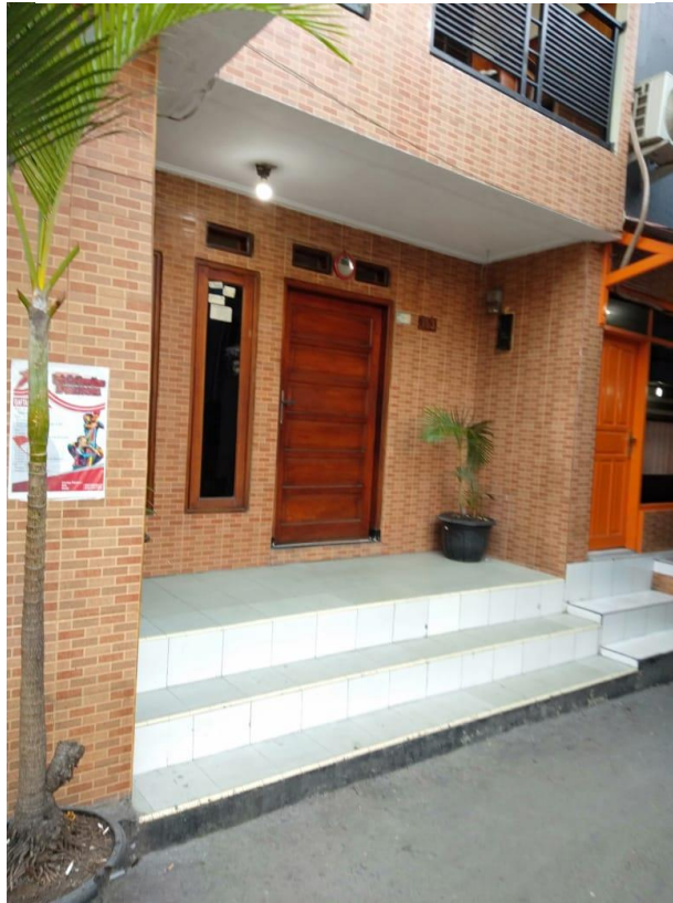
Gambar 1.2 Salah Satu Rumah Dikawasan Lokalisasi Saritem Bandung