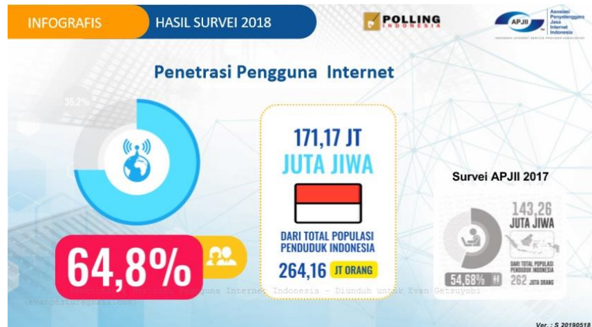
Gambar 1.3 Pertumbuhan Pengguna Internet di Indonesia

Di era digital seperti saat ini, dalam kehidupan sehari-hari tidak lepas dari penggunaan teknologi internet. Teknologi internet ini selain digunakan dalam membantu dalam menjalankan sebuah bisnis juga membantu kegiatan dalam belajar ataupun mengajar bahkan sebagai penunjang dalam gaya hidup terutama bagi masyarakat di Indonesia.