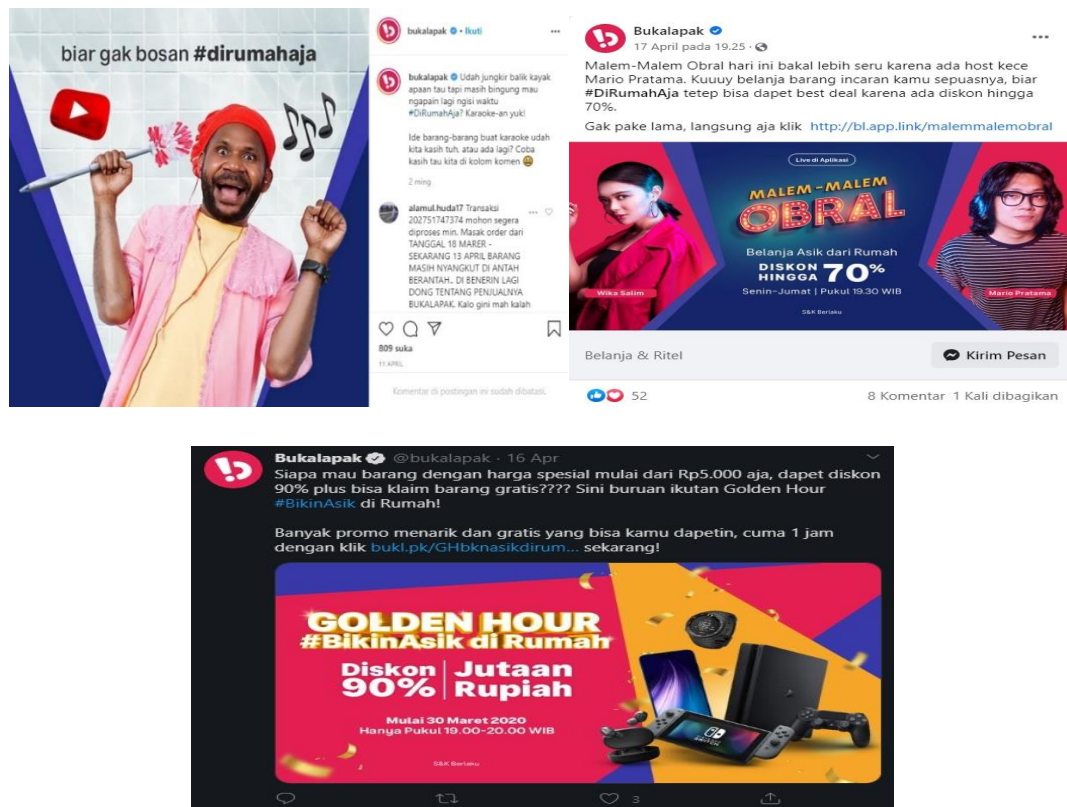
Gambar 1.5 Aktifitas pemasaran media sosial Bukalapak

Menurut Kelly et al., (2010) media sosial sangat berperan dalam aktivitas pemasaran perusahaan yaitu untuk membangun hubungan individu dengan pelanggan misalnya untuk mengakses data. Sehingga apabila bukalahpak tidak meningkatkan pemasarannya melalui media sosial dapat berpengaruh terhadap peningkatan minat beli konsumen. Berikut dibawah ini merupakan aktivitas pemasaran yang dilakukan bukalahpak di media sosial. Berikut dibawah ini merupakan aktivitas pemasaran yang dilakukan bukalahpak di media sosial.