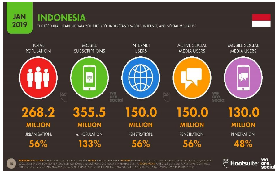
Gambar 1.2 Grafik Pengguna Internet di Indonesia