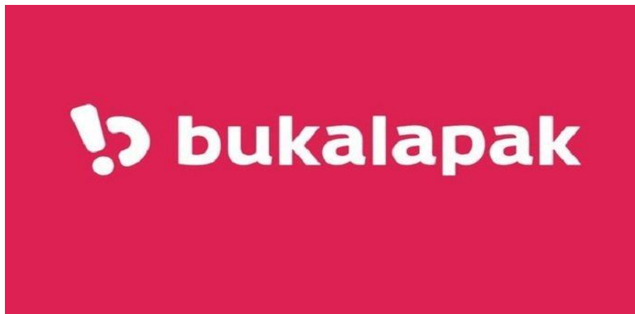
Gambar 1.1 Logo Bukalapak