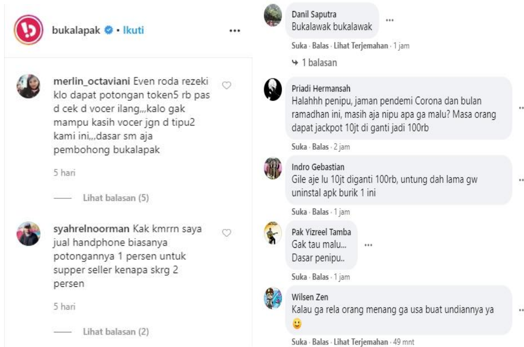
Gambar 1.7 Keluhan konsumen Bukalapak