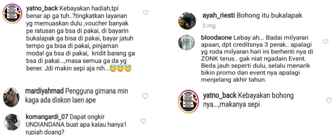
Gambar 1.6 Keluhan pada Social Media Marketing Bukalapak

Masalah masalah yang di alami bukalapak dalam social media marketingnya seperti diatas bisa disebabkan karena beberapa faktor seperti konten yang dibuat bukalapak di media sosial kurang menarik atau promo-promo yang dilakukan bukalapak dimedia sosial kurang jelas dan pesan yang ingin disampaikan di media sosial tidak tersampaikan dengan jelas. Hal ini dapat menjadi masalah bagi bukalapak dalam memperluas jaringan sebuah bisnis dan memperluas pemirsa online . Berikut dibawah ini merupakan keluhan konsumen pada aktifitas social media marketing yang dilakukan bukalapak di media sosial.