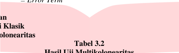
Tabel 3.2 Hasil Uji Multikolinearitas

Variance Inflation Factors Sample: 1 70 Included observations: 70