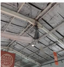
Gambar 3 AC Split