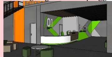
Gambar 2 Konsep Visual

Secara visual, Perancangan ini membawa warna, material dan tekstur layaknya sebuah pabrik atau tempat produksi dengan pengayaan industrial. Konsep visual tersebut digunakan lantaran aktivitas pengguna makerspace ini utamanya yaitu pada kegiatan produksi dan pembuatan sesuatu. Dengan membawa konsep tersebut diharapkan dapat menyesuaikan dengan aktivitas pengguna. Selain itu, untuk menyeimbangi kesan kaku yang dibuat oleh warna dan material yang kasar maka akan disisipkan warna-warna terang sebagai aksen dan diharapkan juga dapat merangsang kreatifitas pengguna.