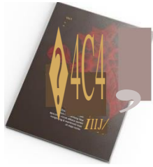
Gambar 5.1 Halaman isi zine