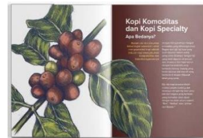
Gambar 4.5 Halaman isi zine Ngopi Apa Hari Ini