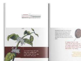
Gambar 4.7 Halaman isi zine Ngopi Apa Hari Ini