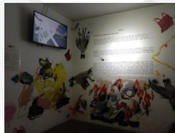
Gambar 2 Tentang Lini Masa

Konsep pada sudut cerita disebut Lini Masa yang memiliki arti yaitu tentang perjalanan waktu. Menceritakan tentang masa ke masa ragam aktivitas serta pola hidup manusia yang menghadirkan bermacam kontribusi sekaligus konsekuensi bagi lingkungan. Seperti pemilihan membuang sampah secara sembaranga adalah contoh kasus sehari-hari yang berkaitan dengan kesadaran hubungan antara manusia dengan lingkungannya.