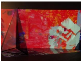
(a) Segitiga Distorsi