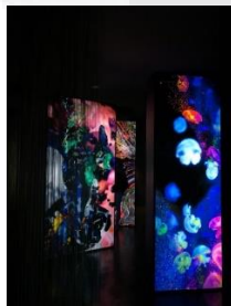
(b) Neon Box