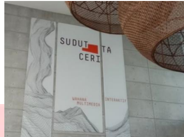
Gambar 1 Lobi Sudut Cerita Bandung

Karya seni instalasi di Sudut Cerita terdiri dari 7 karya dengan 7 ruangan yang berbeda-beda. Sudut Cerita ialah penamaan dari representasi setiap karya yang disajikan, bertujuan untuk menjadi pengingat suatu fenomena atau kejadian yang sejak dahulu hingga sekarang menjadi masalah utama bagi kehidupan semesta yaitu kerusakan alam dan lingkungan.