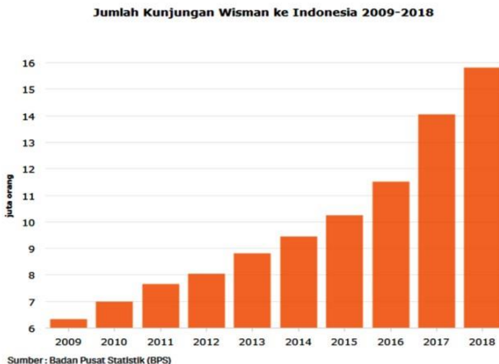
Gambar 1.2 Jumlah Kunjungan Wisman ke Indonesia

pariwisata di Indonesia memiliki prospek yang sangat baik dan dapat berkontribusi terhadap perekonomian di Indonesia.