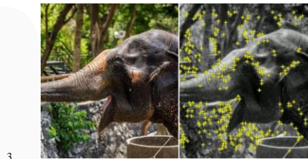
Gambar 2. 1 Marker AR

Marker merupakan sebuah penanda khusus yang memiliki pola tertentu sehingga saat kamera mendeteksi Marker , objek 3 dimensi dapat ditampilkan. Metode marker merupakan metode yang memanfaatkan marker (penanda) berupa ilustrasi hitam putih berbentuk persegi atau ilustrasi gambar dengan warna dan bentuk tertentu [5]. Secara umum metode ini membutuhkan beberapa hal dalam pengolahannya, seperti perangkat komputer atau mobile yang dilengkapi dengan kamera dan sensor pendukung AR, aplikasi AR dan marker . Alur sistemnya yaitu aplikasi AR akan mengakses kamera perangkat kemudian sistem akan mendeteksi marker melalui kamera, lalu menampilkan objek virtual diatas marker pada layar perangkat. Contoh marker AR dapat dilihat pada gambar 2.1.