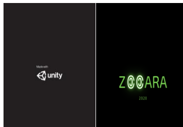
Gambar 3.2 Tampilan splash screen