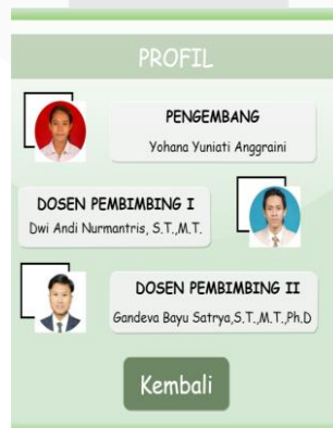
Gambar 3.6 Tampilan Menu Profil