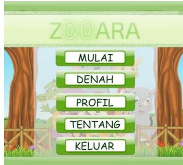
Gambar 3.3 Tampilan Menu Utama