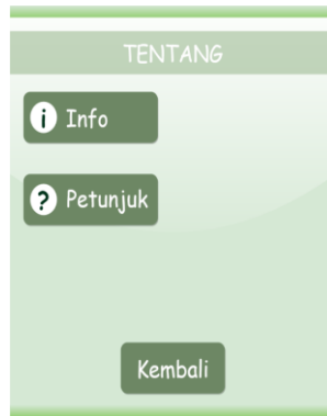
Gambar 3.7 Tampilan Menu Tentang