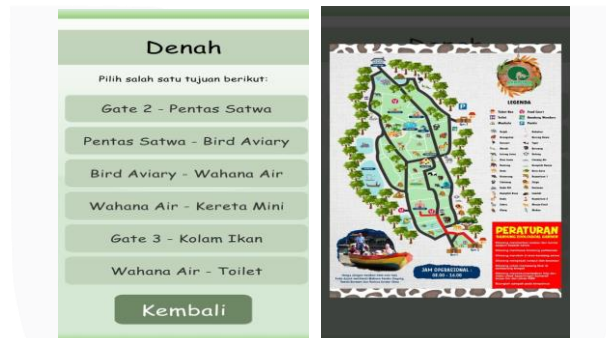
Gambar 3.5 Tampilan Menu Denah