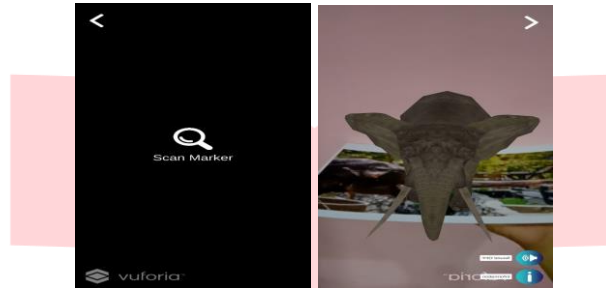
Gambar 3.4 Tampilan Menu Mulai