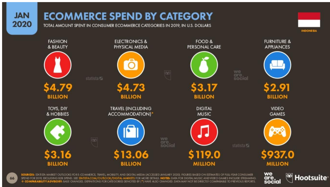
Gambar 1.7 e-commerce spend by category