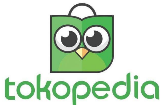
Gambar 1.2 Tokopedia