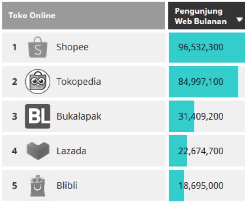
Gambar 1.9 Rata-Rata Kunjungan Web E-commerce Bulanan (Kuartal III, Tahun 2020)