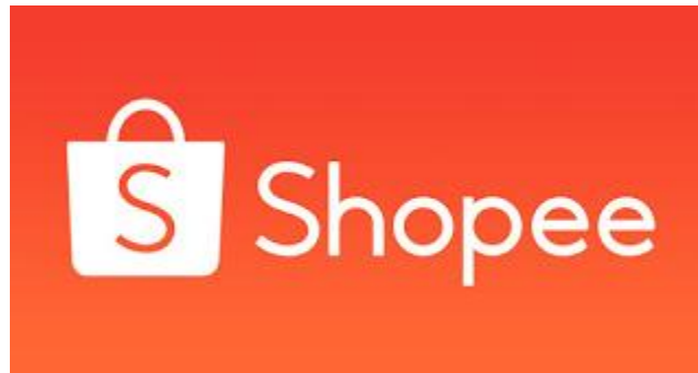
Gambar 1.1 Shopee