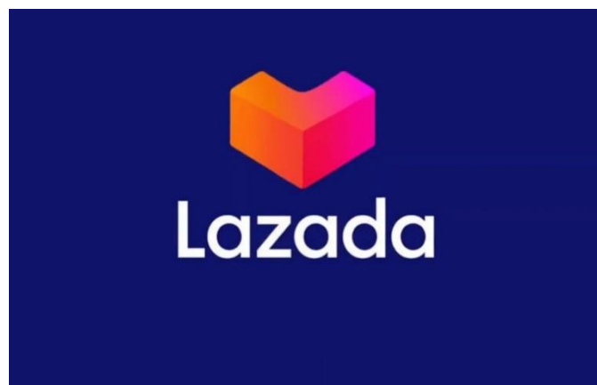
Gambar 1.4 Lazada