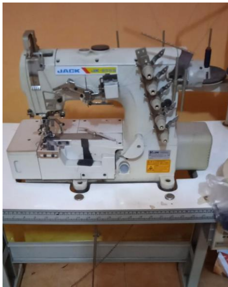
Gambar 1.5 Mesin Overdeck

Mesin wolsum atau krill berguna untuk menjahit tepian kain dengan teknik wolsum. Mesin ini biasanya digunakan dalam model pembuatan jilbab, mukena, seprei, sarung bantal, dan sejenisnya.