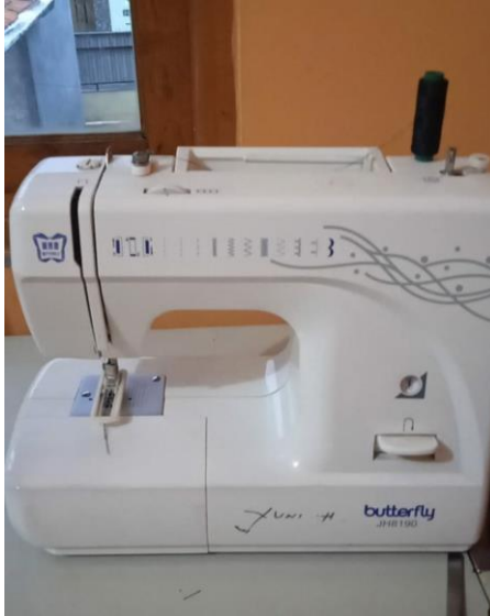
Gambar 1.6 Mesin Jahit Portable Multifungsi

membuat risleting nilon. Mesin overdeck adalah mesin yang mampu meredam kebisingan yang dihasilkan pada saat proses menjahit berlangsung.