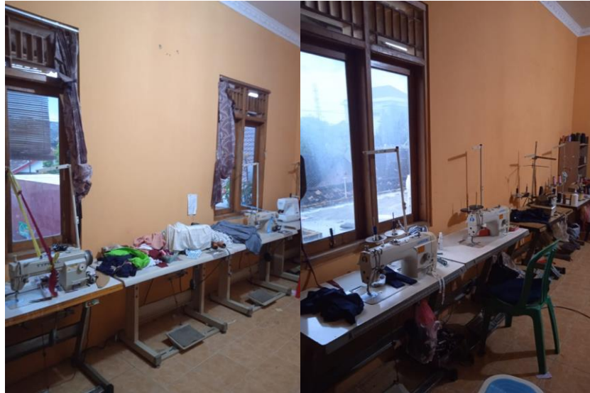
Gambar 1.3 Ruang Jahit

Berikut merupakan gambaran lingkup usaha konveksi H'yunda Collection.