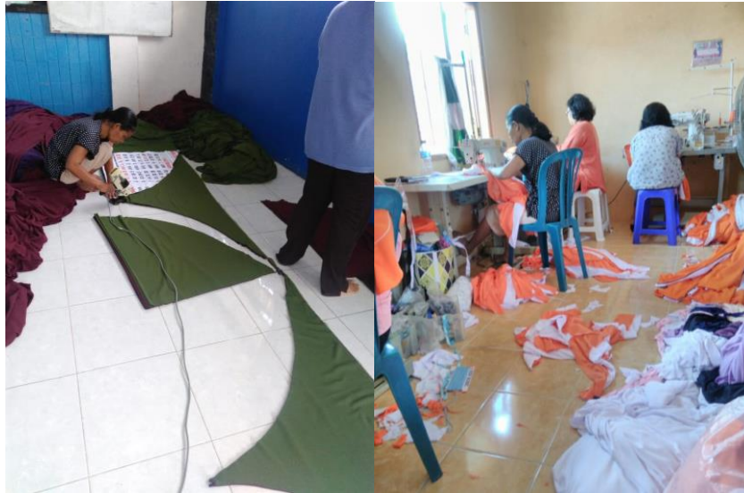
Gambar 1.9 Proses Pengerjaan Pesanan