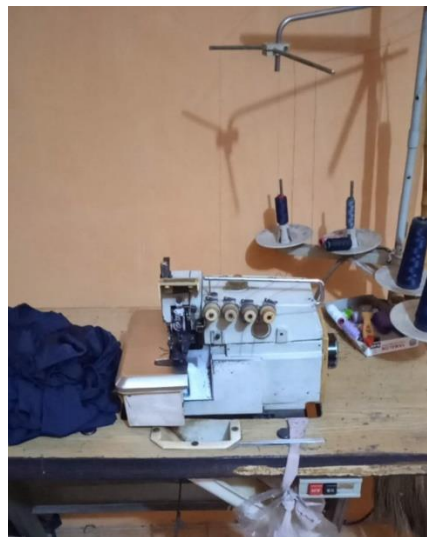
Gambar 1.8 Mesin Jahit Obras

Mesin jahit highspeed ini dapat digunakan untuk keperluan menjahit yang dapat mengaja kestabilan dan kecepatannya yang tinggi. Hasil dari mesin ini dapat menjadikan jahitan lebih maksimal.