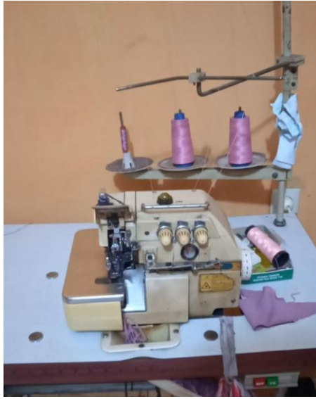
Gambar 1.4 Mesin Wolsum/Krill

Mesin wolsum atau krill berguna untuk menjahit tepian kain dengan teknik wolsum. Mesin ini biasanya digunakan dalam model pembuatan jilbab, mukena, seprei, sarung bantal, dan sejenisnya.