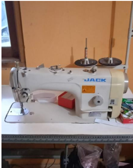
Gambar 1.7 Mesin Jahit Highspeed

Mesin jahit highspeed ini dapat digunakan untuk keperluan menjahit yang dapat mengaja kestabilan dan kecepatannya yang tinggi. Hasil dari mesin ini dapat menjadikan jahitan lebih maksimal.