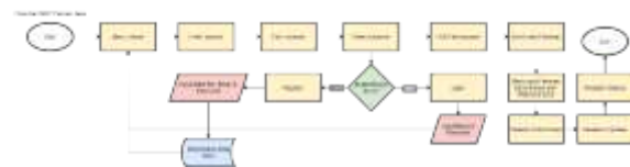
Gambar 2. 3 Flowchart MVP Pencari Jasa

Alur fungsionalitas sistem dalam aplikasi Infineeds tertuang dalam flowchart Minimum Viable Product (MVP) untuk pencari jasa dan penyedia jasa. MVP dalam aplikasi Infineeds yang ditujukan kepada pencari jasa memiliki fitur yang mengakomodir para pencari jasa untuk dapat mendaftar pada aplikasi, melihat daftar layanan, hingga sampai melakukan pemesanan yang dapat dilihat seperti pada gambar berikut.