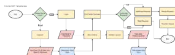
Gambar 2. 4 Flowchart MVP Penyedia Jasa

MVP dalam aplikasi Infineeds yang ditujukan kepada penyedia jasa memiliki fitur yang mengakomodir UMKM penyedia jasa untuk dapat mendaftar pada aplikasi, menambahkan produk atau jasa layanan, melihat daftar transaksi, hingga sampai melakukan konfirmasi dan tolak pesanan yang dapat dilihat seperti pada gambar berikut.