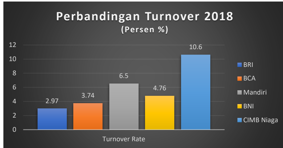
Gambar 1.1 Perbandingan turnover perusahaan perbankan buku IV di Indonesia