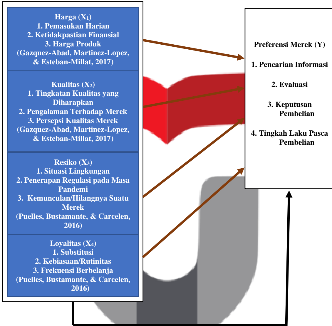
Gambar 2.1 Kerangka Pemikiran Sumber: (Fahmy & Sohani, 2020)