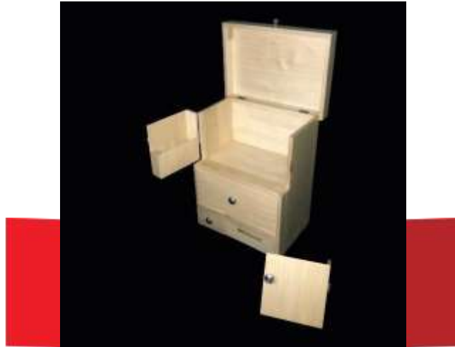
Gambar 7. Detail produk

memiliki bentuk yang beragam dikarenakan kebutuhan penyimpanan diatas meja kerja tujuannya untuk memberikan kenyamanan dan kemudahan aktivitas saat pengguna sedang melakukan aktivitas lainnya.