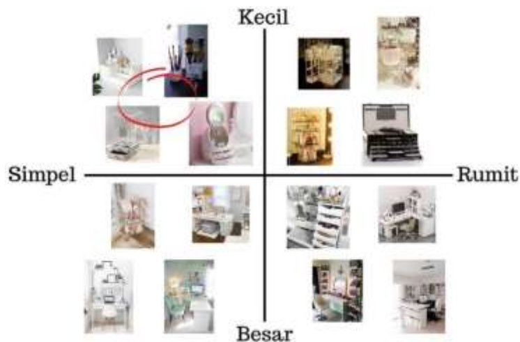
Gambar 4. Imagechart

Pada tahapan mood board merupakan gambaran untuk kebutuhan pada wadah penyimpanan produk kecantikan sehingga bisa disimpan dalam ruang kamar terbatas dan tidak memakan tempat.