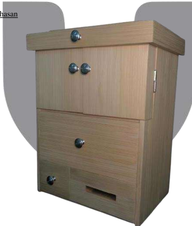
Gambar 6. Wadah Produk Kecantikan