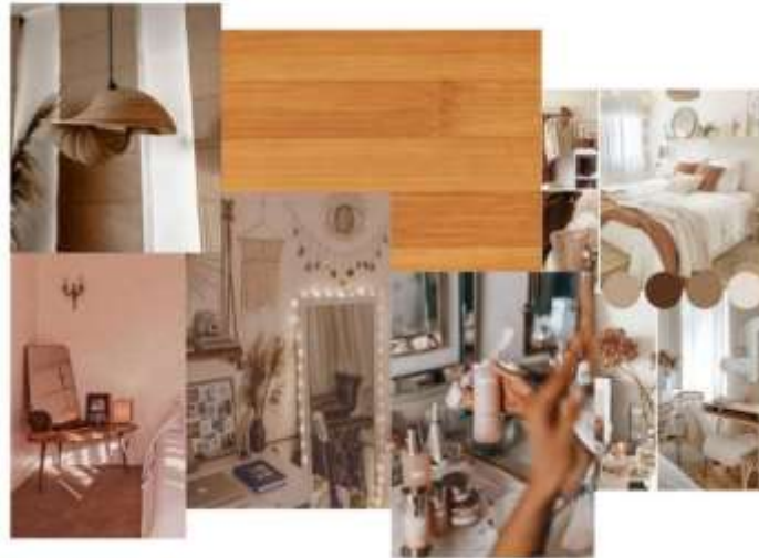
Gambar 3. Moodboard