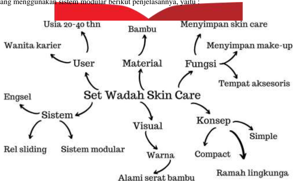
Gambar 2. Mind Mapping

Maka untuk melakukan proses perancangan dilakukan beberapa tahap seperti pembuatan mind mapping , mood board , dan image chart . Hal ini dilakukan untuk mempermudah proses perancangan dan mengetahui produk dan bentuk seperti apa yang akan dirancang. Permasalahan dalam perancangan ini yaitu pengguna yang membutuhkan beberapa wadah untuk menyimpan beberapa produk skin care, make up, beserta aksesoris lainnya, yang mana wadah ini untuk disimpan diatas meja kerja ataupun meja belajar. Maka dari itu penulis merancang wadah yang bisa memenuhi kebutuhan pengguna dengan menggunakan material bambu, dan wadah ini juga dirancang menggunakan sistem modular berikut penjelasannya, yaitu :