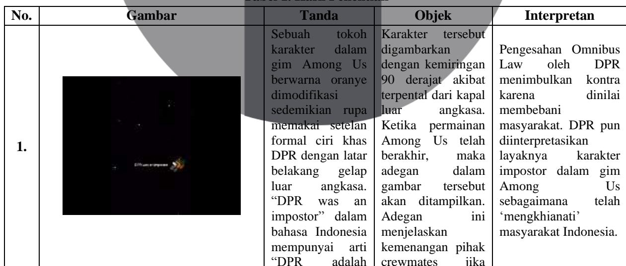
Tabel 1. Hasil Penelitian

Topik pembahasan mengenai isu RUU Cipta Kerja yang dihadirkan melalui bentuk meme Among Us #DPRImpostor sempat menjadi perbincangan hangat dan menembus tagar trending topic di media sosial Twitter sedari awal mula pengesahannya. Jika pada bab sebelumnya, Peneliti telah membahas teori Semiotika Charles Peirce dan budaya populer mengenai meme dan gim daring. Maka pada bab ini, Peneliti berupaya menjabarkan hasil pengamatan mendalam tentang makna sosial yang terkandung di dalam meme #DPRImpostor di kalangan pengguna media sosial Twitter menggunakan kajian semiotika Charles S. Peirce. Dari penelitian ini, peneliti menggunakan 20 data berupa meme #DPRImpostor yang akan dianalisis. Dari data tersebut terdapat berbagai kriteria mulai dari meme yang mendapat respon terbanyak oleh publik hingga tidak mendapat respon sama sekali. Berikut ini merupakan 3 dari 20 data penelitian beserta analisis pada tanda, objek dan interpretan meme Among Us #DPRImpostor.