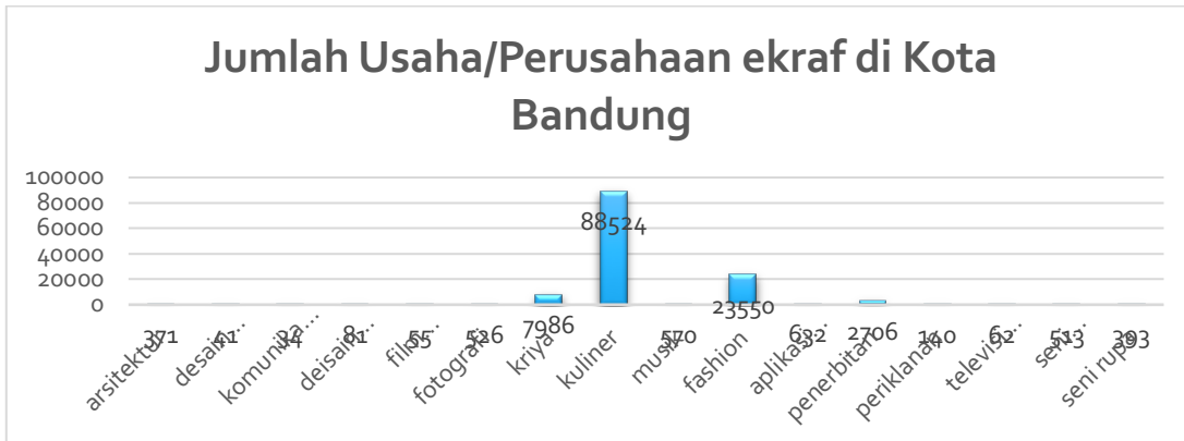
Gambar 1. 4 Jumlah Usaha/Perusahaan ekraf di Kota Bandung

Dengan mudahnya akses untuk memperoleh bahan baku dari luar maupun dalam negeri dan di dorong oleh berkembangnya teknologi yang sangat pesat di Indonesia. Hal tersebut menyatakan bahwa pertumbuhan kuliner itu sangat digemari oleh masyarakat sehingga industri kuliner semakin meningkat di Indonesia sehingga masih menjadi salah satu bagian yang menjadi andalan untuk menopang pertumbuhan manufaktur dan ekonomi nasional (kemenprin.go.id).