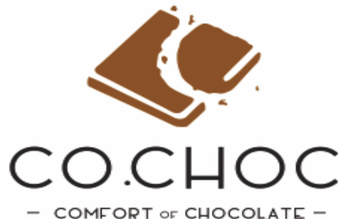
Gambar 1. 1 Logo Co.Choc