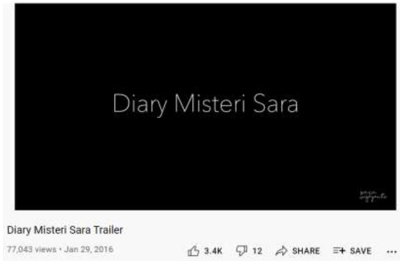
Gambar 4.3 Unggahan Transformasi Branding Sara Wijayanto