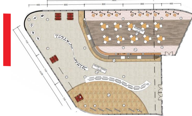
Gambar 5. Layout Galeri dan Workshop

akan ditemukan informasi terkait pembuatan batik dan alat apa saja yang digunakan untuk membuat batik, lalu akan diakhiri dengan karya batik yang di gantung pada sisi sebelah kanan. Layout pada ruang workshop terbagi menjadi 2 bagian, bagian utama adalah bagian tengah ruangan yang dapat digunakan pengunjung saat berkreasi tekstil yang terdapat meja dan bantal untuk alas duduk. Sedangkan area kedua adalah area dekat jendela yang terdapat gawangan dan dinklik yang dapat digunakan untuk membuat batik dengan ukuran yang cukup besar. Pada ruangan ini juga disediakan fasilitas penyimpanan barang pribadi pengunjung dan barang kebutuhan kegiatan workshop. Untuk penyelesaian lantai, pada ruang workshop digunakan vinyl ukuran 120 x 20 cm dan keramik berukuran 60 x 60 cm yang bertujuan untuk memberi pembagian area pada ruangan. Sedangkan untuk galeri menggunakan keramik 100 x 100 cm dengan 2 motif berbeda, hal ini bertujuan untuk memberi pembagian area pada ruang berdasarkan barang yang dipamerkan.