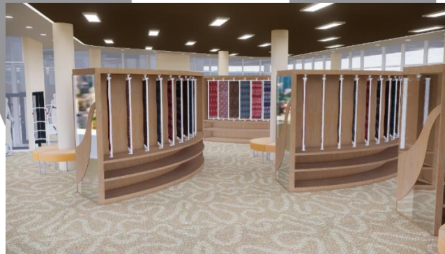
Gambar 4. Pespektif Retail

Pada retail tidak banyak digunakan treatment dinding hanya ditemukan di area kasir yang terdapat penggunaan kayu olahan yang dibentuk seperti motif batik parang, sisi ruangan lainnya didominasi oleh penggunaan jendela kaca dan tidak diterapkan treatment khusus dengan tujuan untuk memaksimalkan pencahayaan alami yang masuk ke dalam ruangan. Untuk penyelesaian ceiling pada retail, material yang digunakan adalah dengan rangka hollow, suspension rod dan gypsum yang dilapisi dengan cat berwarna putih dan coklat. Terdapat penerapan drop ceiling yang dibedakan dengan penggunaan warna pada ceiling. Lampu yang digunakan yaitu LED downlight dan LED panel sebagai pencahayaan utama, sedangkan LED strip digunakan sebagai lampu aksent dengan warna cool white .