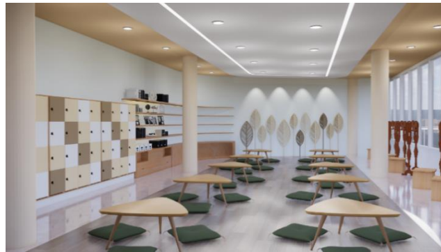
Gambar 7. Pespektif Workshop