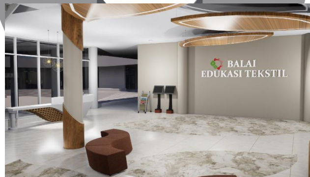
Gambar 2. Pespektif Lobby Utama

Terdapat penggunaan signage LED pada salah satu dinding lobby. Dinding di dominasi dengan warna krem dan terdapat treatment pada kolom lobby dengan menggunakan kayu olahan yang di finishing dengan varnish. Pada lobby ini tidak terdapat banyak olahan pada dinding karena focal point ruangan didapatkan dari elemen lantai dan ceiling. Untuk penyelesaian ceiling pada lobby, material yang digunakan adalah gypsum dengan rangka hollow dan suspension rod yang dilapisi dengan cat berwarna putih dan hpl bertekstur kayu. Terdapat penerapan ceiling gantung yang dibentuk seperti daun. Hal tersebut bertujuan sebagai salah satu focal point dari ruangan. Untuk jenis lampu yang digunakan yaitu LED downlight sebagai pencahayaan utama dan terdapat LED strip yang digunakan sebagai lampu aksen dengan warna warm white .