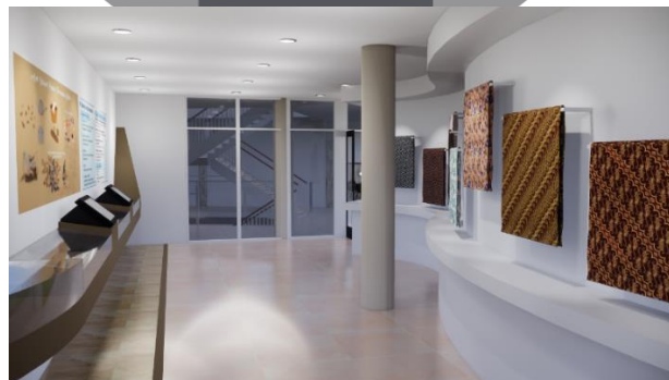
Gambar 6. Pespektif Galeri

Untuk penyelesaian ceiling pada workshop , material yang digunakan adalah dengan rangka hollow, suspension rod dan gypsum yang dilapisi dengan cat berwarna putih dan coklat. Lampu yang digunakan yaitu LED downlight sebagai pencahayaan utama, terdapat pula penggunaan lampu sorot pada salah satu dinding yang terdapat treatment dinding, sedangkan LED strip digunakan sebagai lampu aksent dengan warna cool white . Untuk penyelesaian ceiling pada galeri, material yang digunakan adalah dengan rangka hollow, suspension rod dan gypsum yang dilapisi dengan cat berwarna putih dan coklat. Lampu yang digunakan yaitu LED downlight sebagai pencahayaan utama, terdapat pula penggunaan lampu sorot yang diarahkan pada produk-produk yang dipamerkan.