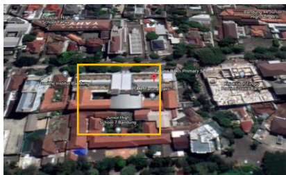
Gambar 1. 1 Peta Lokasi Proyek