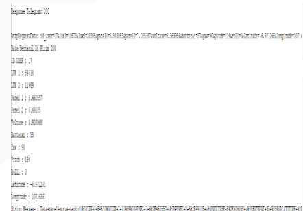
Gambar 1(d) Serial Monitor

Gambar 1(d), menunjukkan data parameter yang ditampilkan pada Serial Monitor ESP32. Data parameter ditampilkan pada Serial Monitor ESP32 setiap 15 menit sekali secara otomatis. Data parameter berupa ID dari User , sensor tegangan, Lux 1, Lux 2, Panel 1, Panel 2, baterai, Yaw, Pitch, Roll, Latitude dan Longitude.