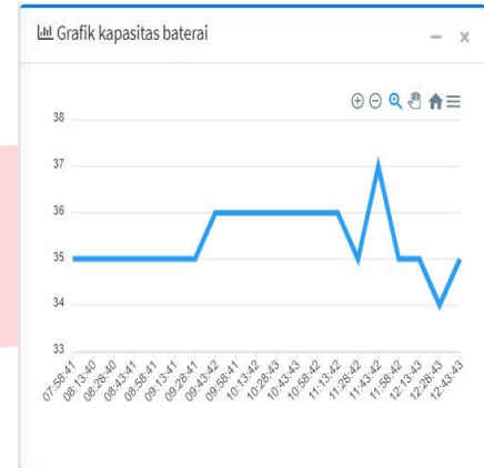
Gambar 1(c) Grafik Kapasitas Baterai

Didapatkan hasil grafik pada penelitian di Pagi Hari, berikut ini :