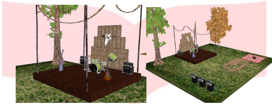
Gambar 3 Media Utama

Untuk media pendukung dari strategi promosi ini, penulis menggunakan beberapa media pendukung sebagai berikut: