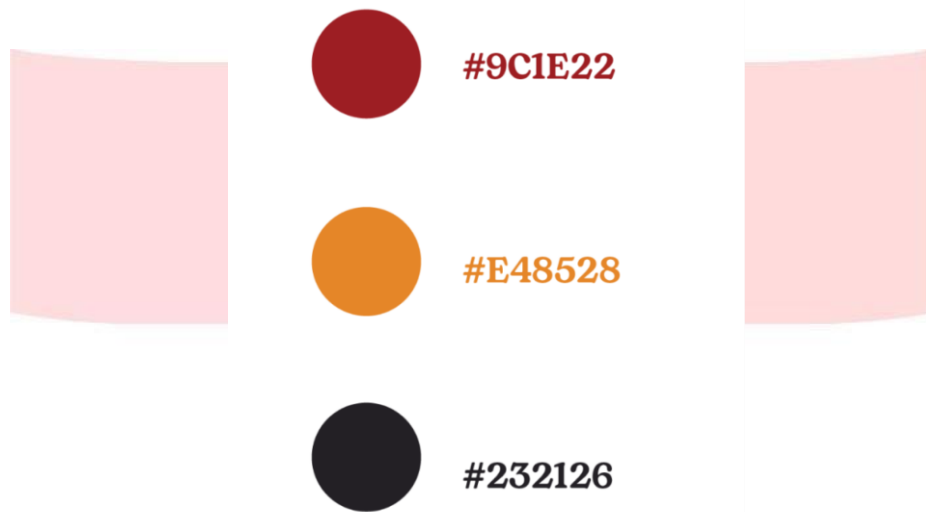
Gambar 1 Warna