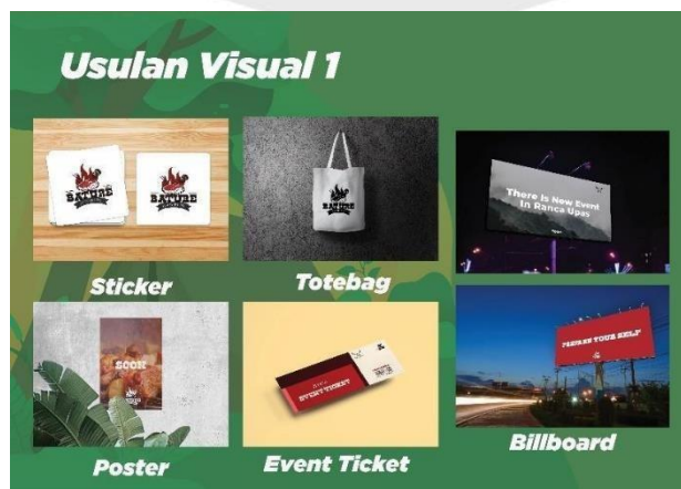
Gambar 5 Sticker, Totebag, Billboard, Poster, Event Ticket