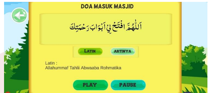
Gambar 4.3 Implementasi Tampilan Doa Masuk Masjid

Pada gambar 4.3 terdapat ayat , latin beserta artinya. Jika ingin mendengar Doa tersebut bisa di klik play dan jika ingin berhenti klik pause.