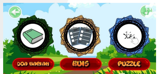
Gambar 4. 1 Implementasi Tampilan Doa Harian

Pada gambar 4.1 Menu Tampilan jika ingin ke menu doa harian