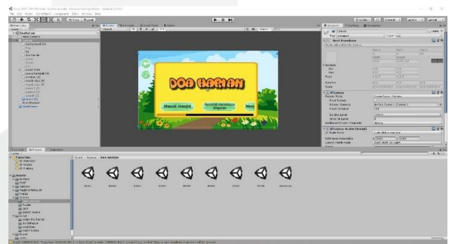
Gambar 3.4 Perancangan Tampilan Menu Doa Harian

Gambar 3.4 perancangan untuk menu doa harian terdapat 4 doa yang dapat dipilih.