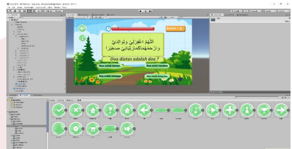
Gambar 3.2 Tampilan Awal Doa Harian

Pada gambar 3.2 desain tampilan awal untuk doa harian menggunakan corel draw.