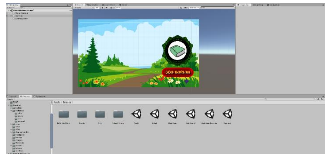
Gambar 3.3 Perancangan Menu Doa Harian

Gambar 3.3 perancangan menu doa harian di unity