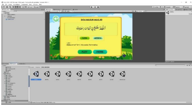
Gambar 3.5 Perancangan Tampilan Doa

Gambar 3.5 jika memilih salah satu doa pada menu doa harian terdapat ayat dari doa tersebut dengan latin beserta artinya. Dan klik button play jika ingin mendengarkan suara dari ayat dan arti dari doa tersebut