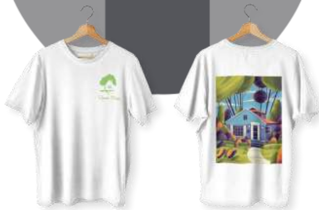
Gambar 12. Hasil Desain Merchandise