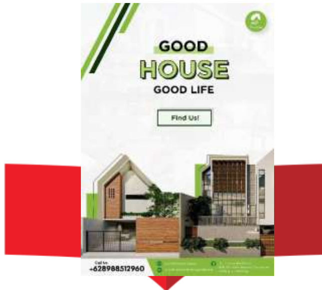
Gambar 3. Hasil Perancangan Poster Cetak