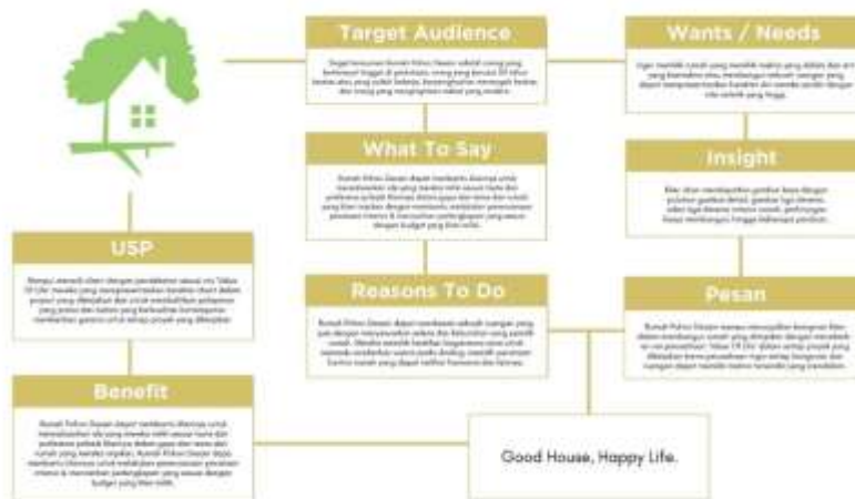
Tabel 1. Analisis Big Idea

Dengan menekankan ‘ Value Of Life ’ dalam setiap proyek yang perusahaan kerjakan, sangat diharapkan target audience dapat mendapatkan pesan yang perusahaan Rumah Pohon Desain ingin sampaikan melalui strategi promosi yang penulis akan lakukan bahwa Rumah Pohon Desain ialah perusahaan dengan jasa desain interior, arsitektur dan mebel yang modern karna mampu menciptakan desain interior dengan cerita yang calon klien miliki melalui iklan Hardsell dan juga Softsell .