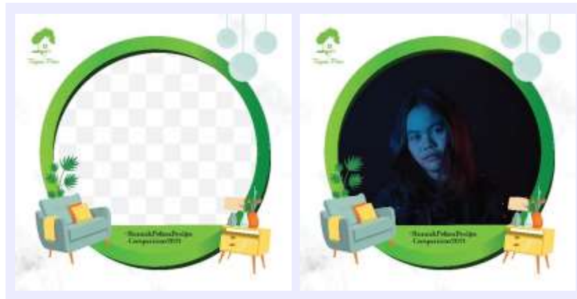
Gambar 11. Hasil Twibbon