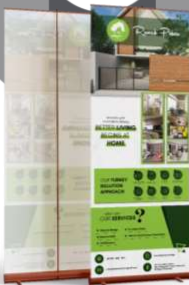
Gambar 4. Hasil Perancangan X-Banner