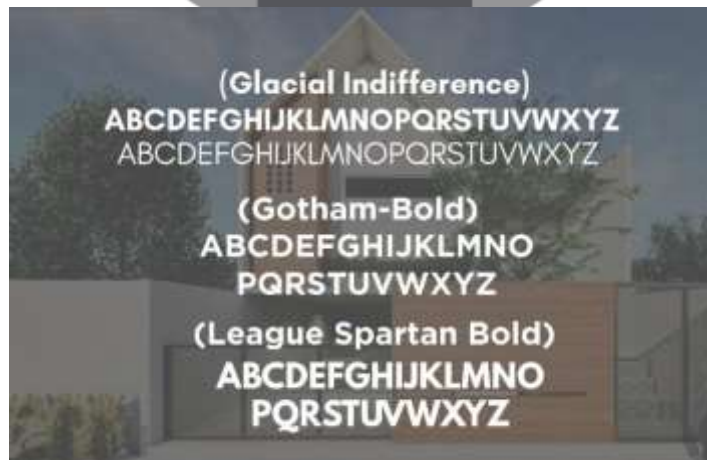
Gambar 2. Font

Tipografi yang digunakan ialah font berjenis sans serif dengan karakteristik bold , tegas dan modern dengan menghadirkan kesan formal dan mudah untuk dibaca bagi orang dewasa sesuai dengan target.