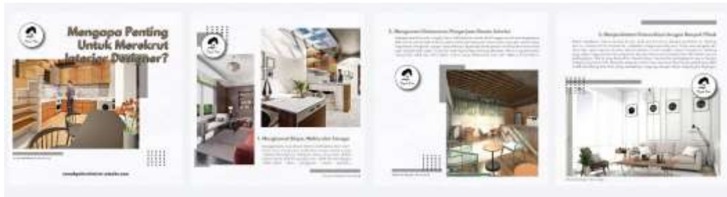
Gambar 8. Hasil Perancangan Konten Instagram Perusahaan