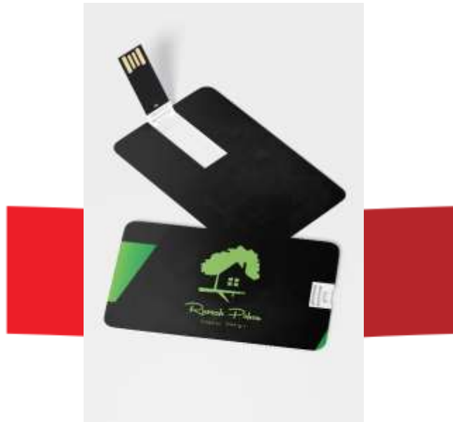
Gambar 13S. Hasil Desain Merchandise