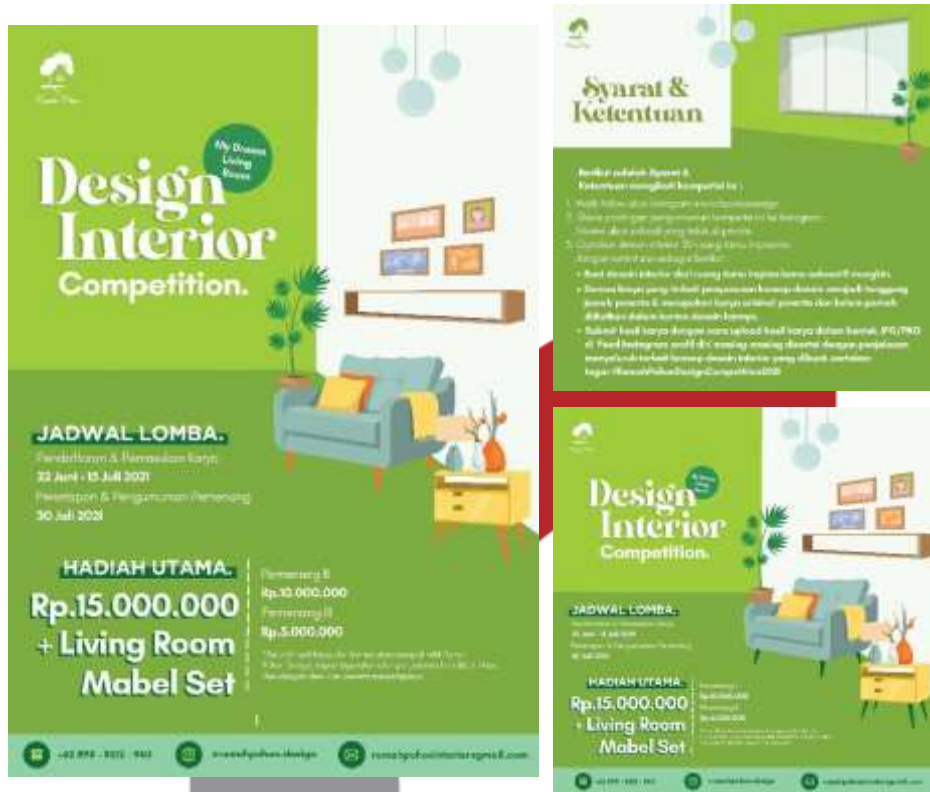
Gambar 10. Hasil Poster Lomba Perusahaan