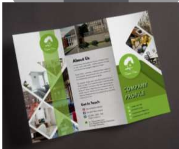
Gambar 6. Hasil Perancangan Flyer