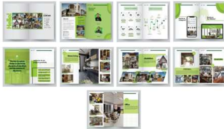
Gambar 5. Hasil Perancangan Company Profile