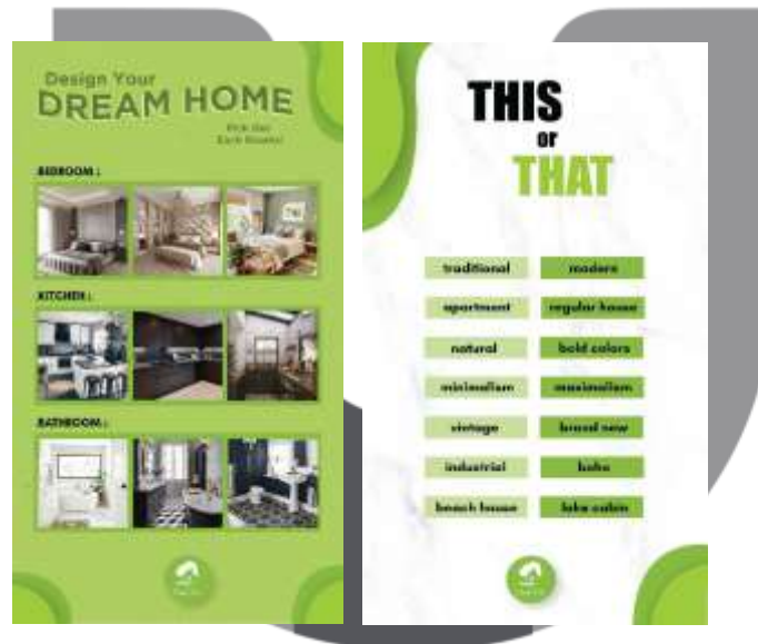
Gambar 9. Hasil Konten Interaktif Sosial Media Perusahaan