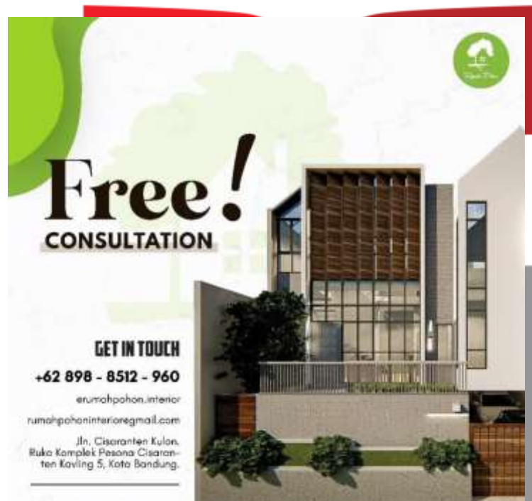
Gambar 7. Hasil Perancangan Poster Promosi Digital