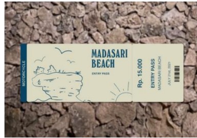
Gambar 7 Tiket