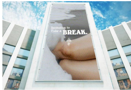
Gambar 5 Baliho