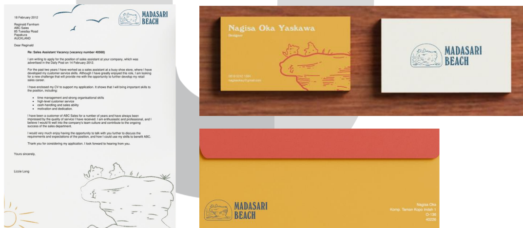
Gambar 2 Stationery