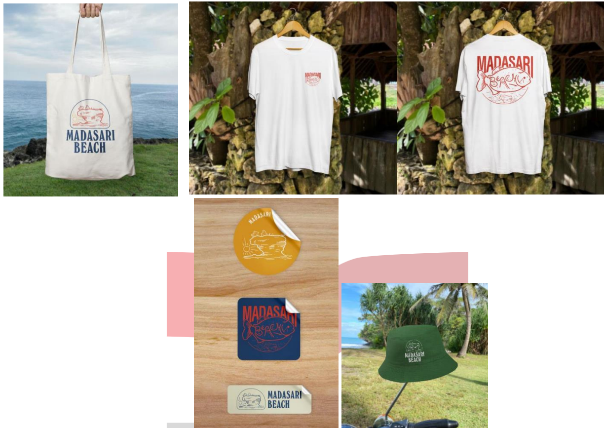
Gambar 3 Merchandise