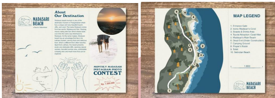
Gambar 8 Brosur