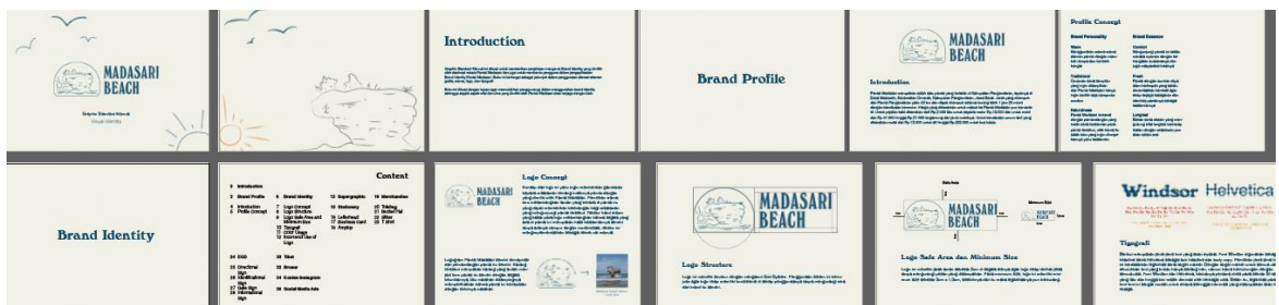
Gambar 1 GSM